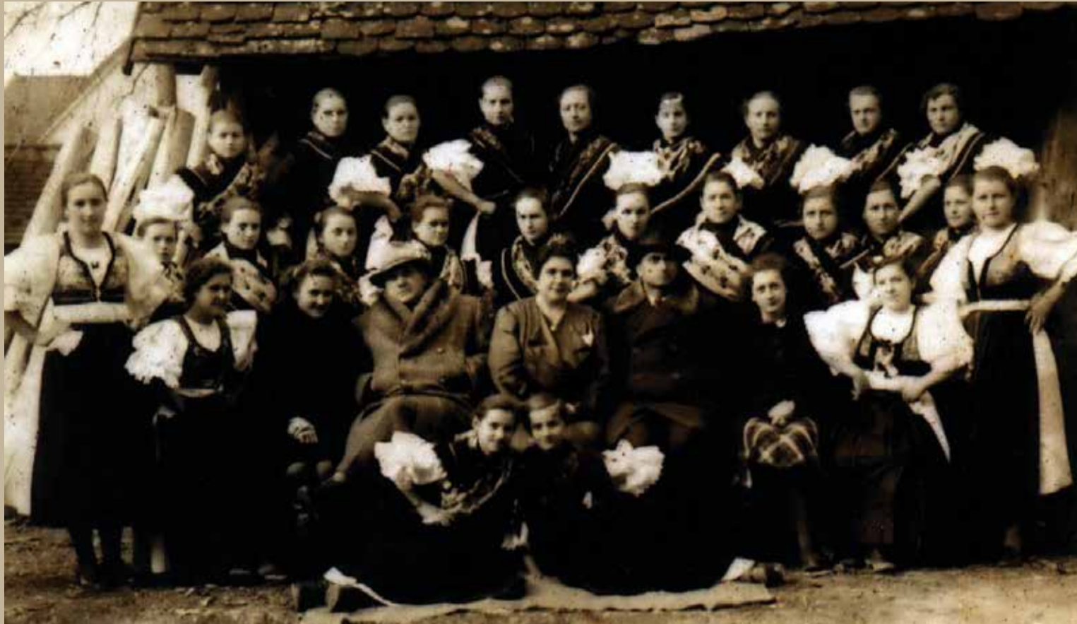
Članice Ogranka Seljačke sloge Donja Dubrava 1941. godine (možda se fotografija odnosi na kakav domaćinski tečaj ili možda na društvo Lira?)

Dobrava je osim svojih gospodarskih potencijala, koje je prvenstveno donosio razvijeni obrt i fljojsarstvo, imala i visoku razinu razvijene kulture, društvenog i obrazovnog djelovanja. Tako se postojanje pučke škole u Dobravi spominje već 1786. godine (učitelj je bio Anton Lustig), a velebna školska zgrada koja i danas stoji na pijacu izgrađena je već 1858. godine. Kao učitelj, orguljaš, pa i općinski bilježnik, u Dobravi djeluje i znameniti hrvatski pjesnik Stjepan Belovari (1784. – 1867.). Godine 1897. osnovano je župno Društvo sv. Krunice koje je imalo i svoj pjevački zbor. I jedna od najstarijih međimurskih limenih glazbi osnovana je u Donjoj Dubravi 1888. godine pri našem DVD-u. Za potrebe te glazbe Maks Mirschler 1902. godine dao je iz Beča dopremiti koncertni klavir i 16 instrumenata. U Donjoj Dubravi rođen je i veliki mađarski pjesnik Zoltan Somlyo (1882. – 1937.) koji je napisao antologijske pjesme na mađarskom jeziku s temom o Dobravi i Dravi. Taj kulturni polet završio je 1911. godine osnivanjem agilnog Građanskog društva koje je objedinjavalo raznolike društvene aktivnosti u mjestu.