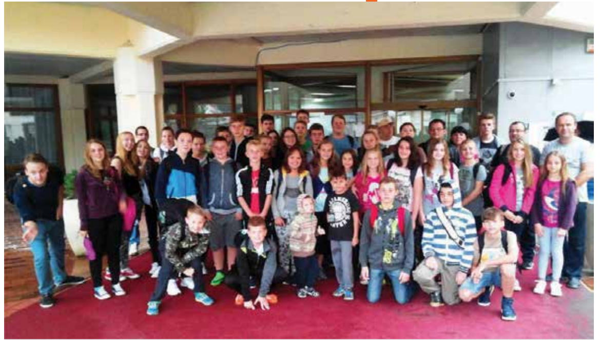
Izlet sa Slogašima u Varaždinskim toplicama

5.9.2015. Zajedno s mladim članovima KUD-a „Seljačka sloga“ izveli smo se na zaslužni izlet i kupanje u Va-