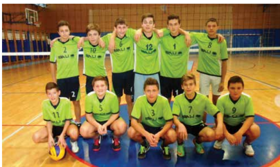
ŠSD Drava - i ove godine plasirali su se na Županijsko natjecanje u odbojci