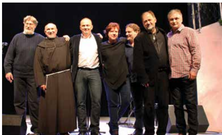
Predstavljanje nosača zvuka "Dar dobrote" u kazalištu Komedija