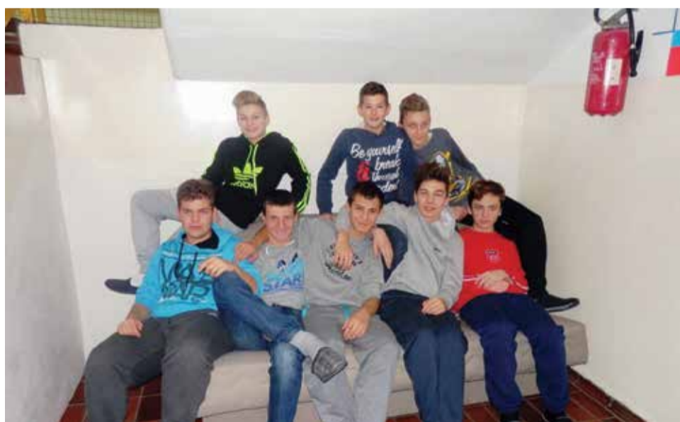
Osmaši na kauču