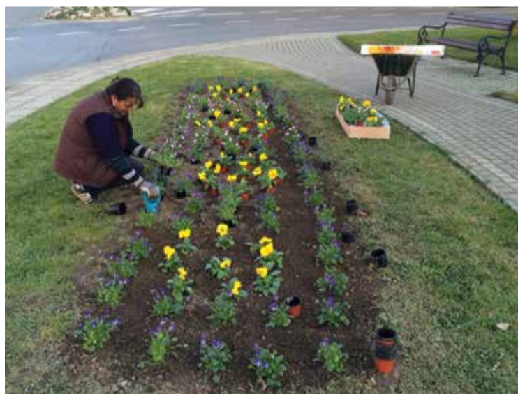
Uređenje javne površine

Podravsku ulicu. Budući da su za navedene lokacije nadležne Hrvatske ceste, sukladno dogovoru, one će izvršiti radove iscrtavanja pješačkih prijelaza prilikom prvog sljedećeg dolaska u Donju Dubravu, dok će Općina financirati kupnju prometnih znakova.