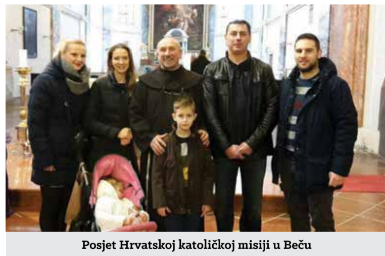
Posjet Hrvatskoj katoličkoj misiji u Beču