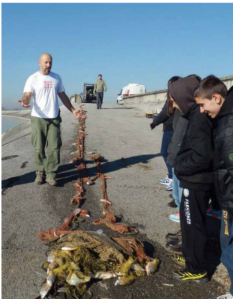
Monitoring ribljeg fonda

Čestit Božić i uspješnu novu godinu želi vam uredništvo Dobravskih novina!