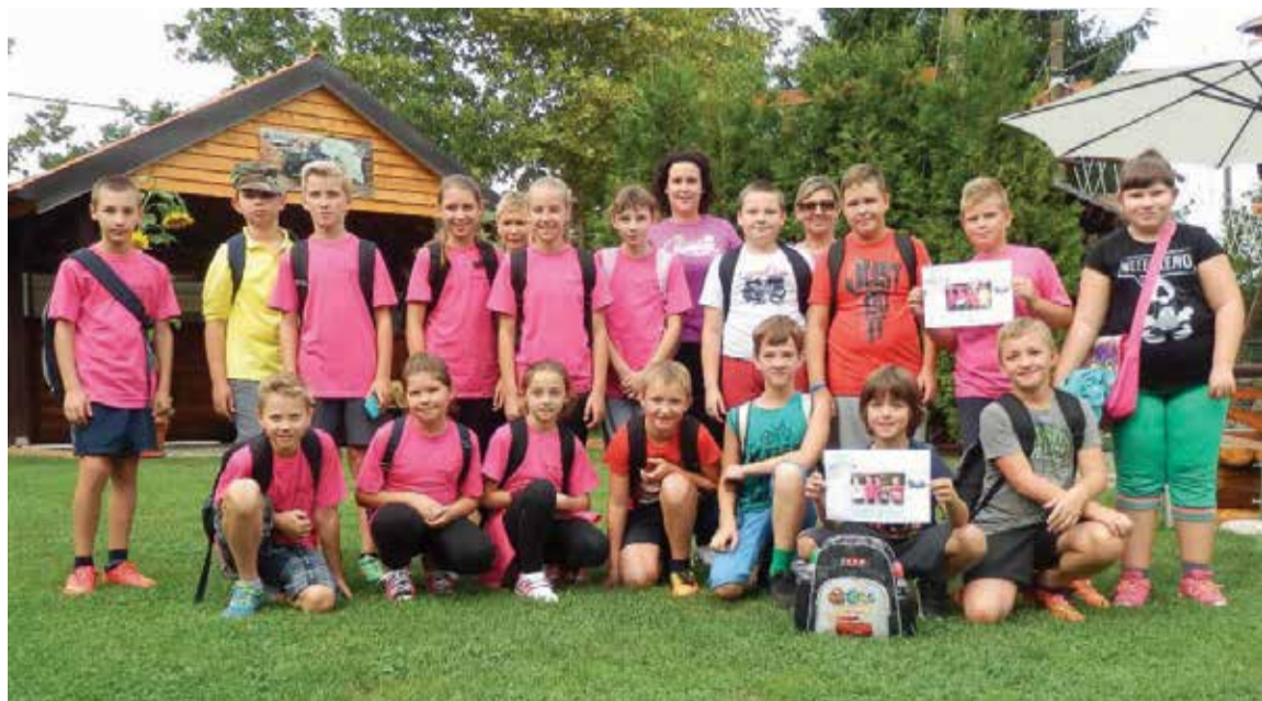
Acreddocentar - nagradni izlet za četvrti razred