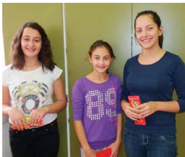
Akcija Crvenog križa "Solidarnost na djelu" - najbolja ekipa