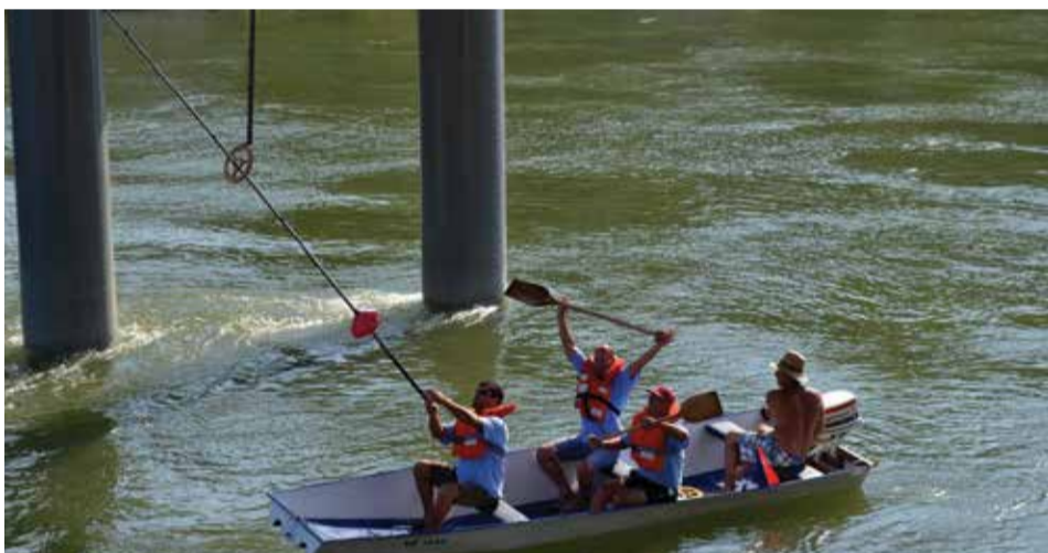
Pobjednici natjecanja Lov na zlatarski prsten