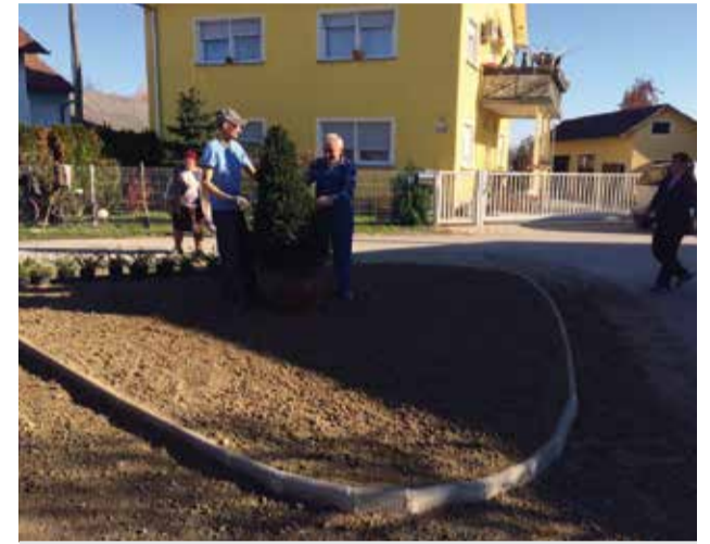
Uređenje parkića u Vinogradarskoj ulici

Na zahtjev stanara Vinogradarske ulice i uz pomoć istih, a na prijedlog Mihaele Horvat, uređen je parkić