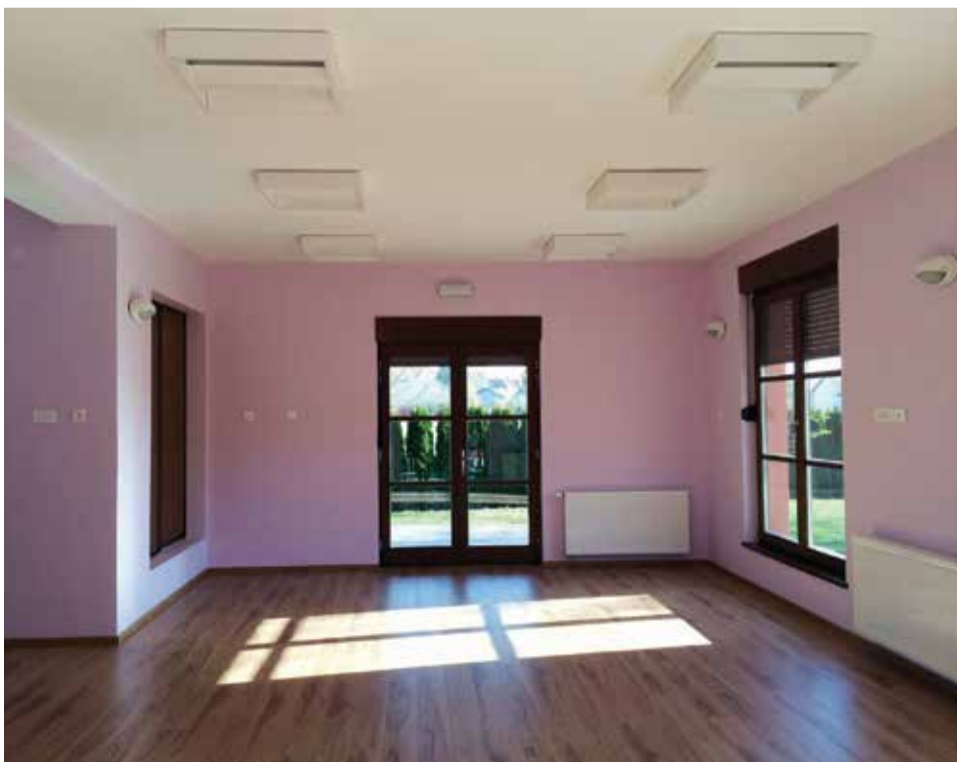
Unutrašnje uređenje rekonstruiranog vrtića

Projektom rekonstrukcije (dogradnje) vrtića koji je završen, dobiveno je novih neophodnih 48,75 m 2 zatvorenog i korisnog prostora za 52 polaznika vrtića iz obje skupine koji će komotnije uživati u igri i boravku.