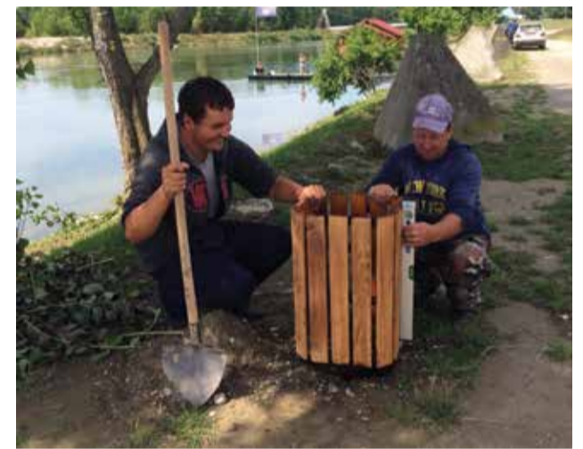
Postavljanje koševa za smeće

s novim prikladnijim nasadima. Upravo na njezin prijedlog na skroman način uređeni su i grobovi Dobravčana židovskog podrijetla zaslužnih za sve učinjeno u njihovo doba, te još nekoliko lokacija u mjestu.