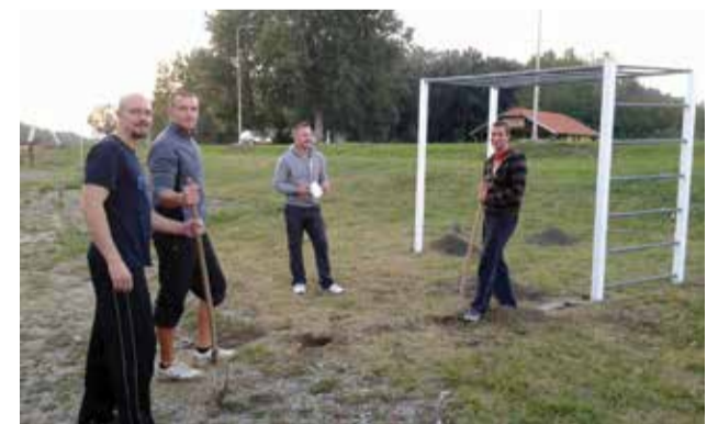
Postavljanje vježbališta uz Dravu

U sklopu šetnice na inicijativu grupe mještana izrađeno je i vježbalište koje su postavili sami inicijatori. Izvrstan prijedlog te dodatna zanimacija za sve rekreativce.