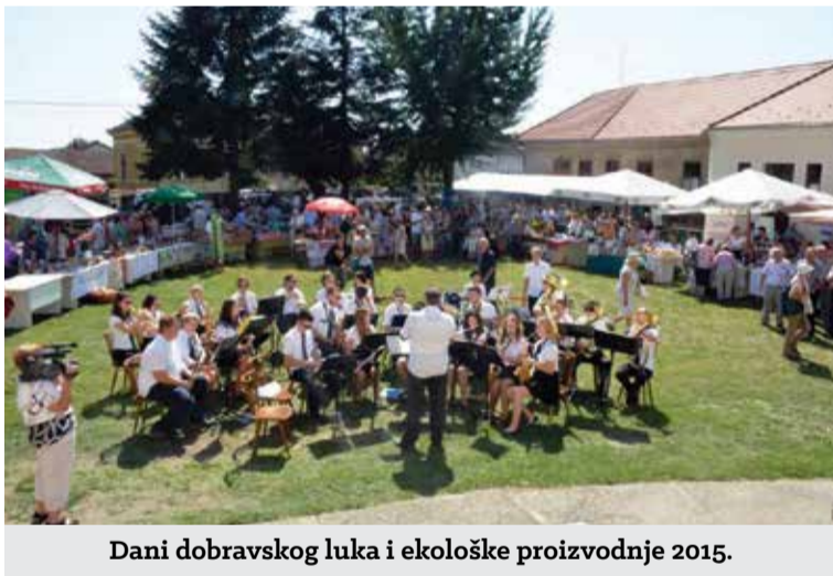
Dani dobravskog luka i ekološke proizvodnje 2015.

branika Gorana Vadle i doprinijeli obilježavanju njihovog svečanog dana. Neka im je sa srećom!