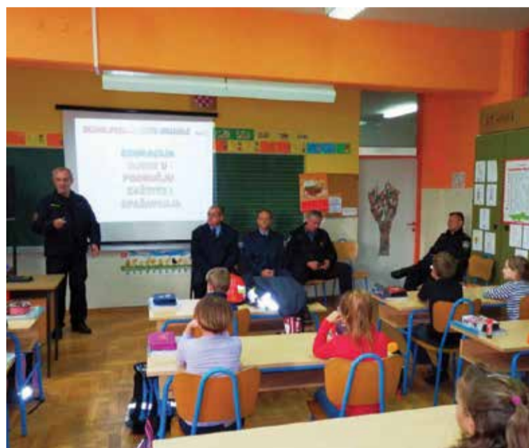
Predavanje o zaštiti i spašavanju

Ravnateljica i zaposlenici OŠ Donja Dubrava