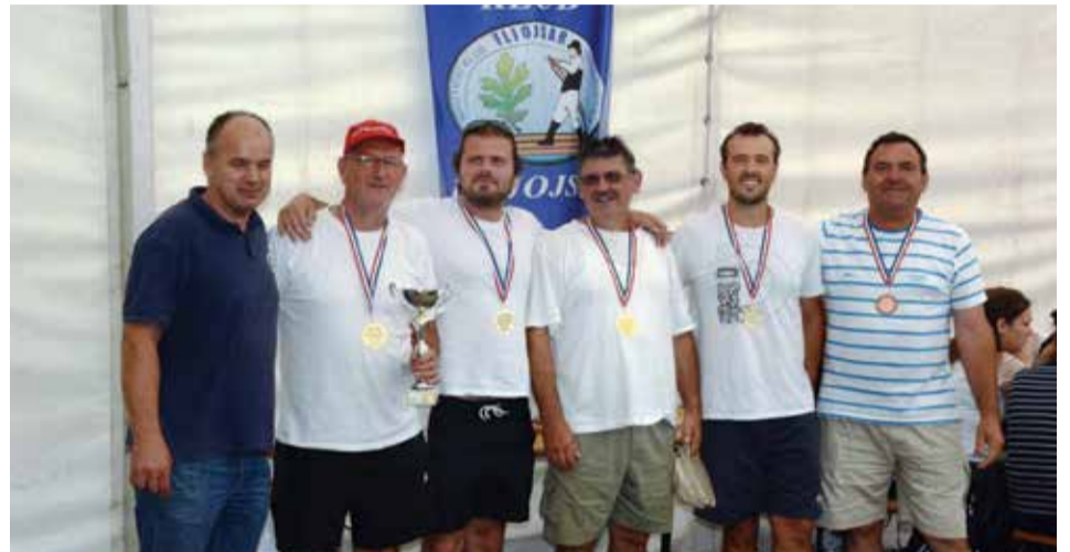
Pobjednici muškog ekipnog veslanja Dravske regate