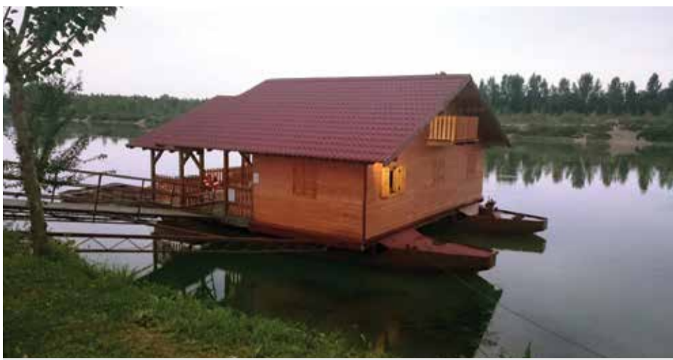
Dom Fljojsara na Dravi