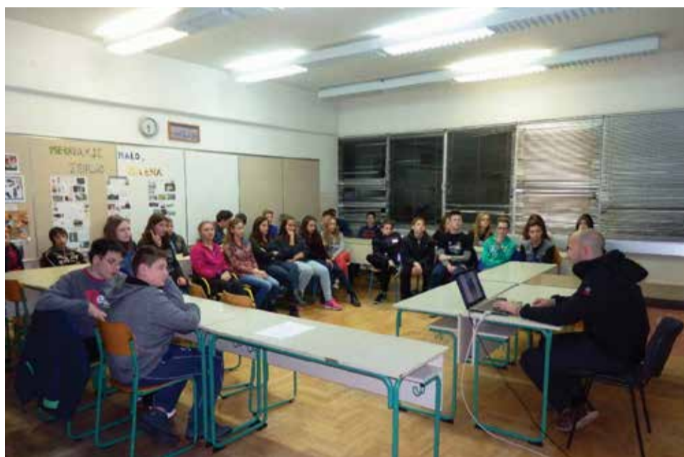
Predavanje - Dijabetes bez predrasuda