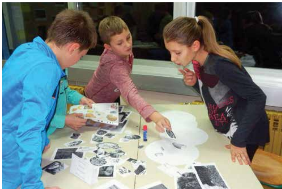
Radionica za učenike - Dijabetes bez predrasuda