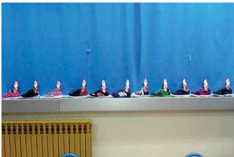
Sveti Nikola posjetio je učionice razredne nastave