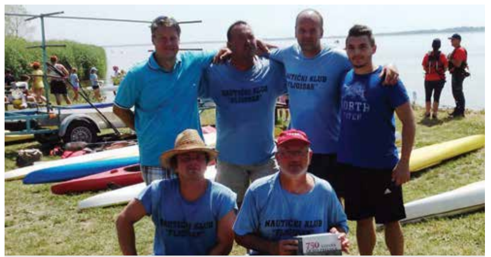
Natjecanje muških ekipa Dravske regate 2015.