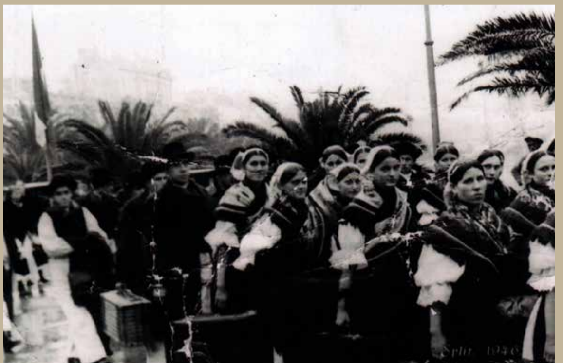
Ogranak Seljačke sloge Donja Dubrava snimljen na rivi u Splitu 1946. godine (možda su to članovi društva Lira?)

bili tzv. diletanti (dramska sekcija), u Seljačkoj slozi najaktivnija je bila folklorna grupa, uz čuvanje dobravskih narodnih nošnji. Zasad nam nije poznat i sastav toga ogranka, kao niti imena vodstva. Neki su zacijelo prešli iz KPD-a Dubravka. Folkloristi ogranka nastupali su i izvan Donje Dobreve. Ogranak je u doba mađarske vlasti od 1941. do 1945. godine bio zabranjen, ali je nastavio djelovati odmah krajem 1945. godine. Prema jednoj fotografiji iz 1946. godine,