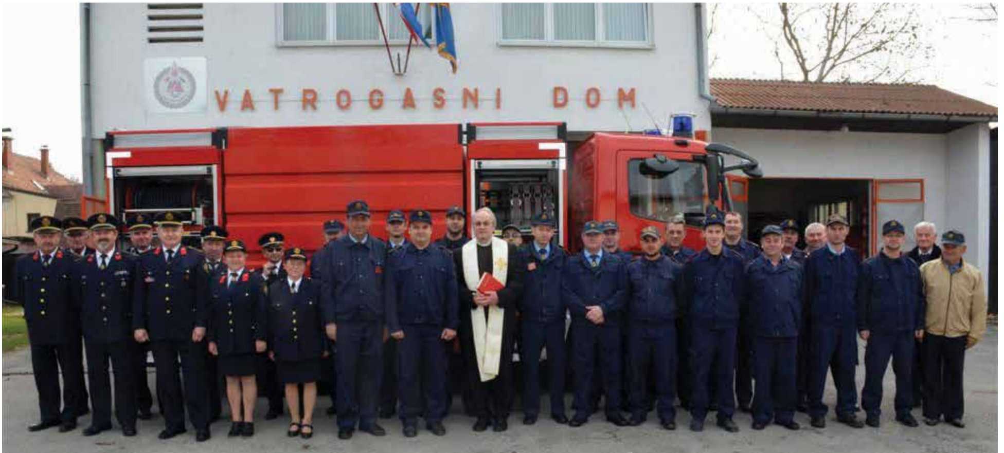
„Neka ovo vozilo putuje s Božjim blagoslovom na korist svih mještana Donje Dubrave!“