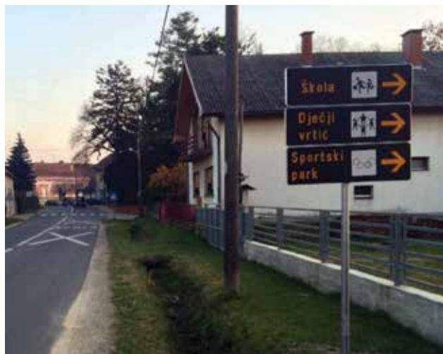
Postavljene obavijesne ploče

ploče na križanju ulica Trg republike i Zagrebačka s ulicom Krbulja. Za postavljanje znakova Općina je morala izraditi elaborat kao dokument potreban za dobivanje suglasnosti Hrvatskih cesta.