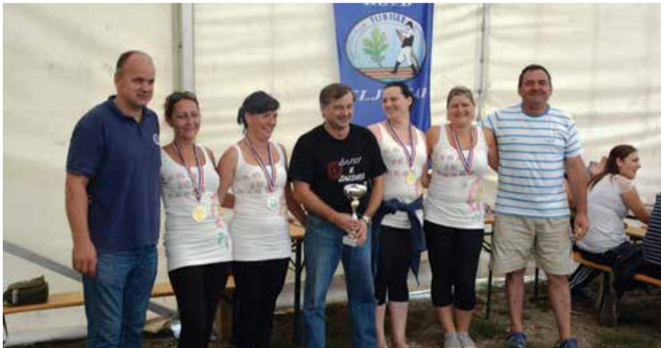
Pobednice ženskog ekipnog veslanja Dravske regate