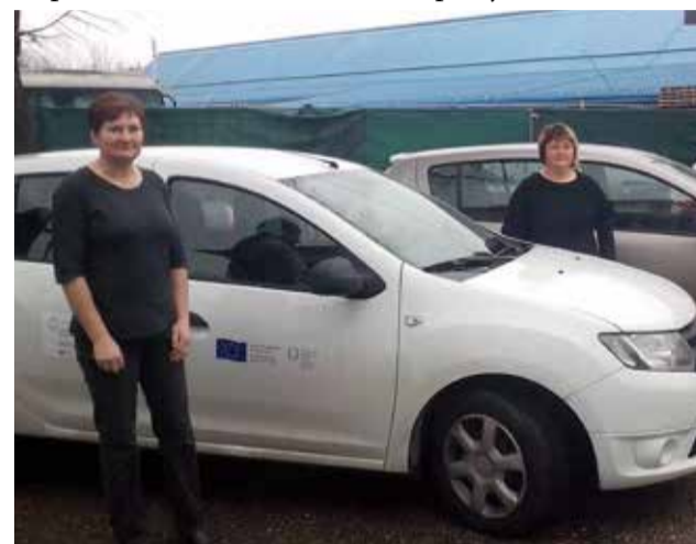
Naše gerontodomaćice svakodnevno obilaze korisnike diljem Međimurja

Pratiti nas možete i na Facebook stranici: Centar za pomoć u kući Međimurske županije.