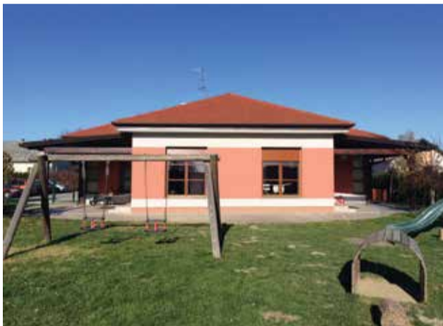
Rekonstruiran (dograđen) Dječji vrtić

Nakon zaprimljenih ponuda za projekt rekonstrukcije (dogradnje) općinskog Dječjeg vrtića „Klinčec“, potpisan je ugovor s tvrtkom MA-MI d.o.o. iz Svete Marije koja je dostavila najpovoljniju ponudu u vrijednosti od 209.961,88 kn.