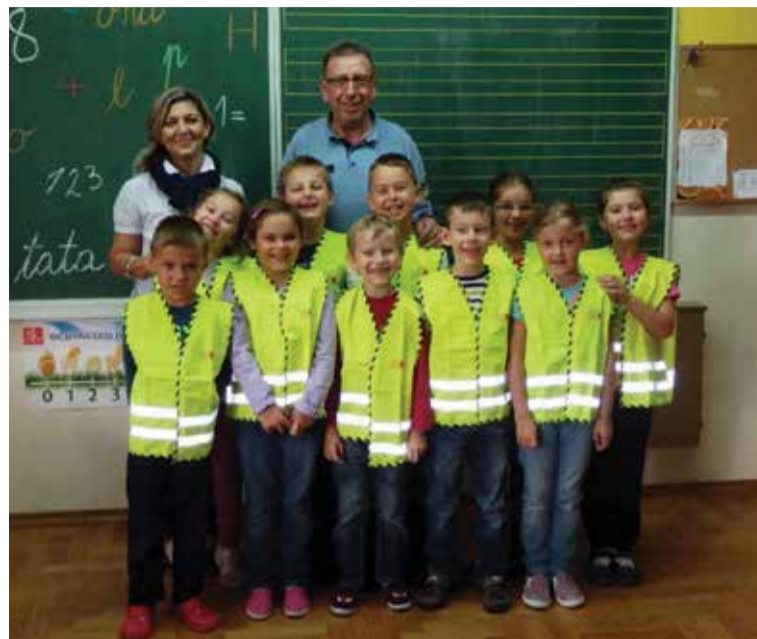
Sigurno u prometu