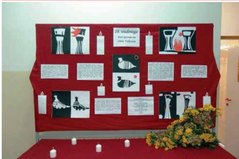
Dan sjećanja na žrtvu Vukovara