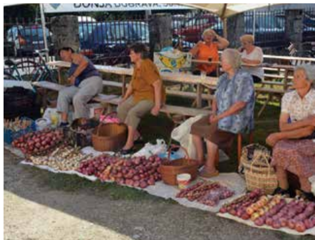
Dani dobravskog ljuka i ekološke proizvodnje 2015.

Moram napomenuti da je od strane nekih ovaj projekt u početku gledan s podsmjehom i neodobravanjem, kao da je neostvariv, slično kao i kad smo predlagali da se postave dječja igrališta. Žalostno i licemjerno. Naime, takvi stavovi dolaze od osoba koje bi se najviše trebale zalagati za kvalitetniji život naše djece.