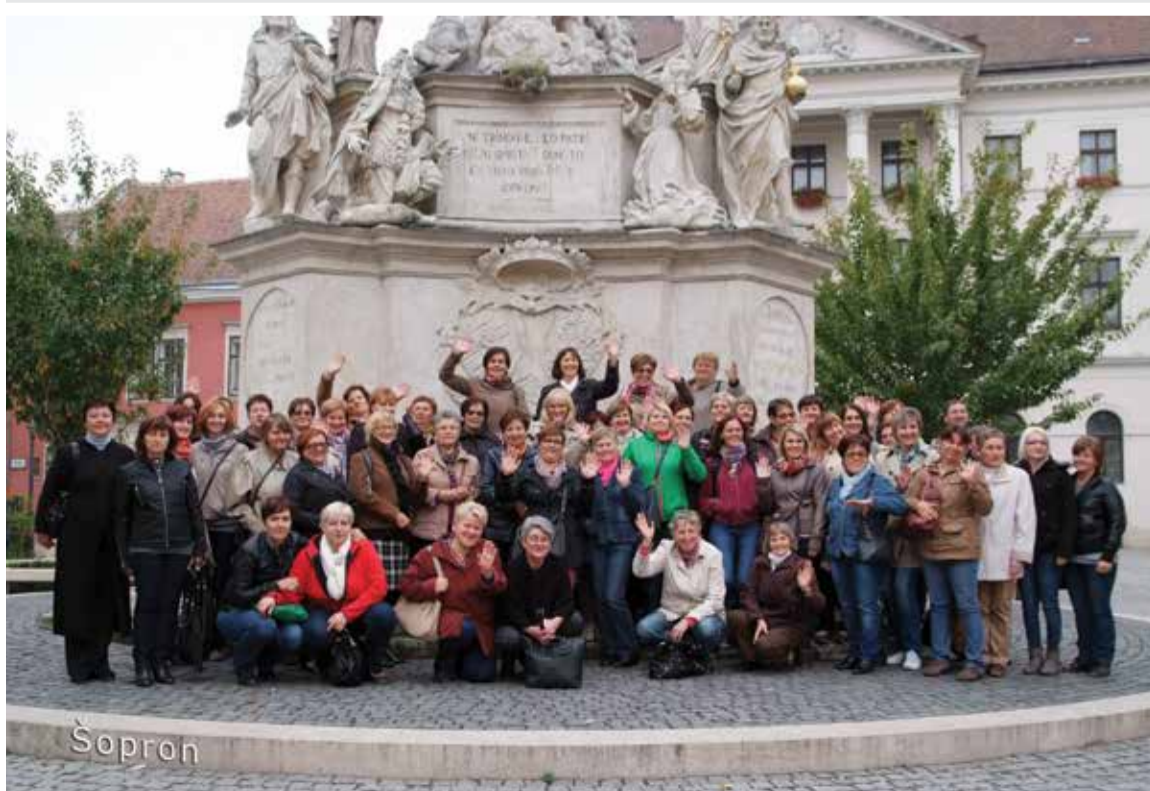
Izlet u Šopron