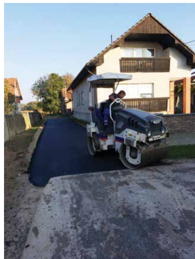
Asfaltiranje Brodarske ulice

Sljedeće godine slijedi nastavak priprema i izrada projektnih dokumentacija za koje treba i vremena i novca, ali su neophodne za apliciranje na javne pozive Ministarstva te na mjere Ruralnog razvoja kao i za dobivanje raznoraznih suglasnosti ili pak dobivanje građevinskih odnosno uporabnih dozvola.