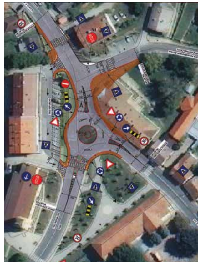
Budući rotor u centru Donje Dubrave

Za potrebe naše Župe u Ministarstvo Regionalnog razvoja i fondova europske unije dostavljen je projekt