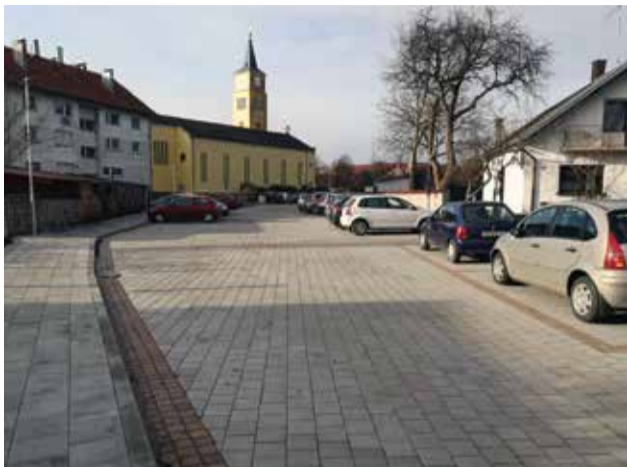
Odvodnja i parkiralište iza crkve

U centru Dobrave iza crkve uređena je odvodnja oborinskih voda zatvorenim sustavom, uređena pješačka staza na pravcu ulice Prilaz prema Trgu Republike, proširena je javna rasvjeta, te na novo asfaltirane javne površine na pravcima ulaska do parkirališta. Ovaj projekt provodio se paralelno sa projektom izgradnje parkirališta tvrtke Bali d.o.o., a općina je to financirala iznosom od 273.801,50 kuna.