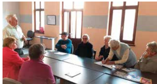
Klubovi za starije osobe u partnerstvu sa Udrugom potrošača „Međimurski potrošač“ održali su predavanje o pravima potrošača s naglaskom na starije osobe kao potrošače

Pomoć u kući je dostupna, samo se treba javiti Centru za pomoć u kući Međimurske županije