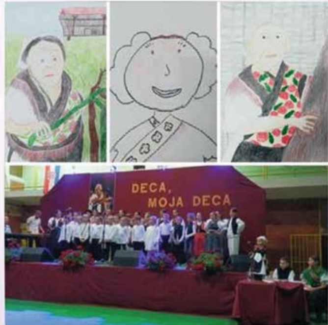
Spomen na tetu Lizu čuvamo kroz likovni, literarni i glazbeni natjecaj u kojem sudjeluju svi učenici škole.