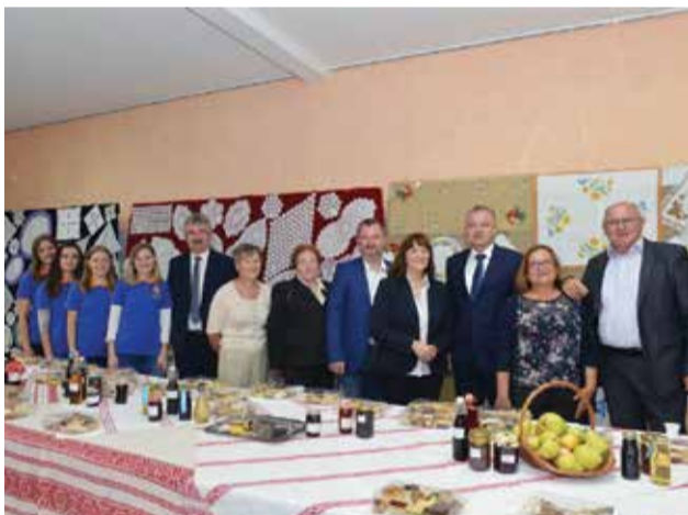
Posjet ministra Horvata Danima dobavskog ljuka

Eto i ove godine održani su još jedni dan dobavskog ljuka i ekološke proizvodnje. Kao i obično uz pomoć naših vrijednih članova pojedinih dobavskih udruga, kojima istinski zahvaljujem na angažmanu, postignuto je zadovoljstvo svih sudionika. I ove godine bilo je dosta izlagača, njih 54 i svi iznimno zadovoljni. Ovaj puna vremena za duži razgovor imao je i ministar gospodarstva i poduzetništva Darko Horvat.