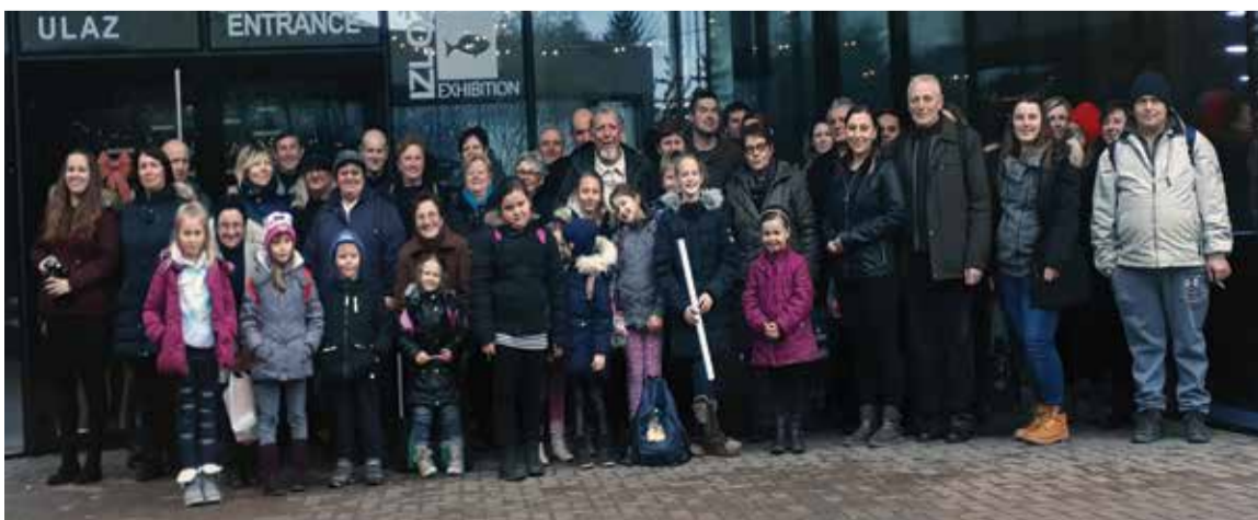
Izlet u Aquatiku - slatkovodni akvarij Karlovac