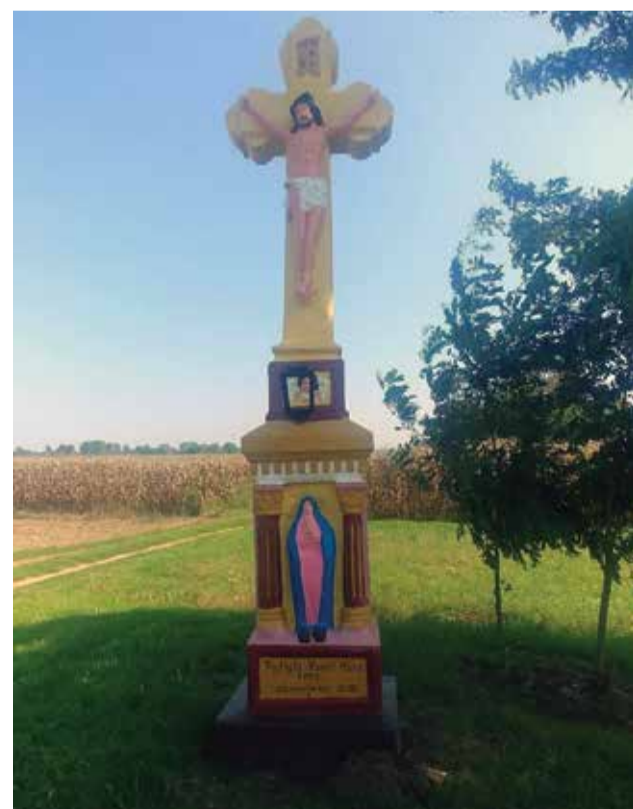
Obnovljena dva pila