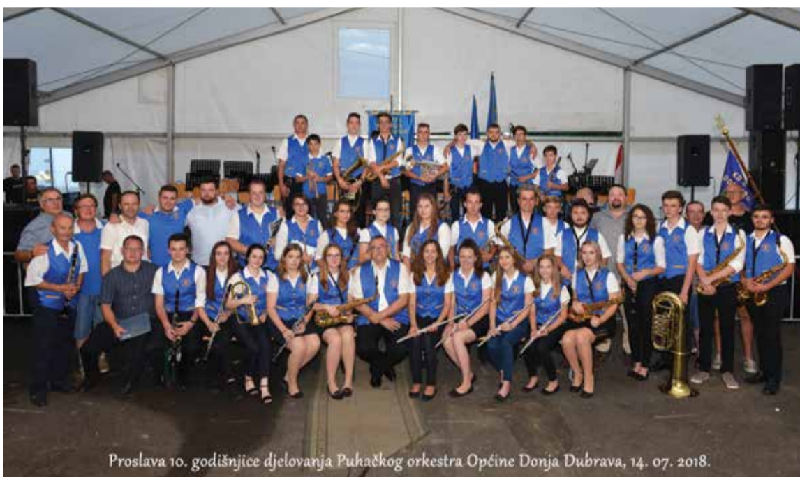
Proslava 10. godišnjice djelovanja Puhačkog orkestra Općine Donja Dubrava, 14. 07. 2018.