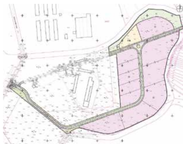
Gospodarska zona sjever

Eto pri kraju je i izrada Detaljnog uređenja gospodarske zone, kojom rješavamo obilazak privatne parcele tvrtke Agromeđimurje, te stvaramo prostor za potrebe poduzetnika površine oko 9 hektara. U ovom trenutku postoje dva poduzetnika zainteresirana za kupnju i to jedan za 5 a drugi za 1,5 hektara. U razgovoru sa našim dobravskim ministrom Darkom Horvatom tijekom Gospodarskog foruma, naznačene su mogućnosti financiranja poduzetničkih zona pa očekujemo i tu potporu iz gradnje.