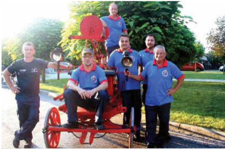
Naši seniori u Svetoj Mariji

Državna uprava za zaštitu i spašavanje, Crveni križ, Javna vatrogasna postrojba Čakovec, Hrvatska gorska služba za spašavanja te, uz nas, i dobrovoljni vatrogasci iz Donjeg Vidovca, Kotoribe, Svete Marije, Donjeg Mihaljevca, Prelova i Goričana.