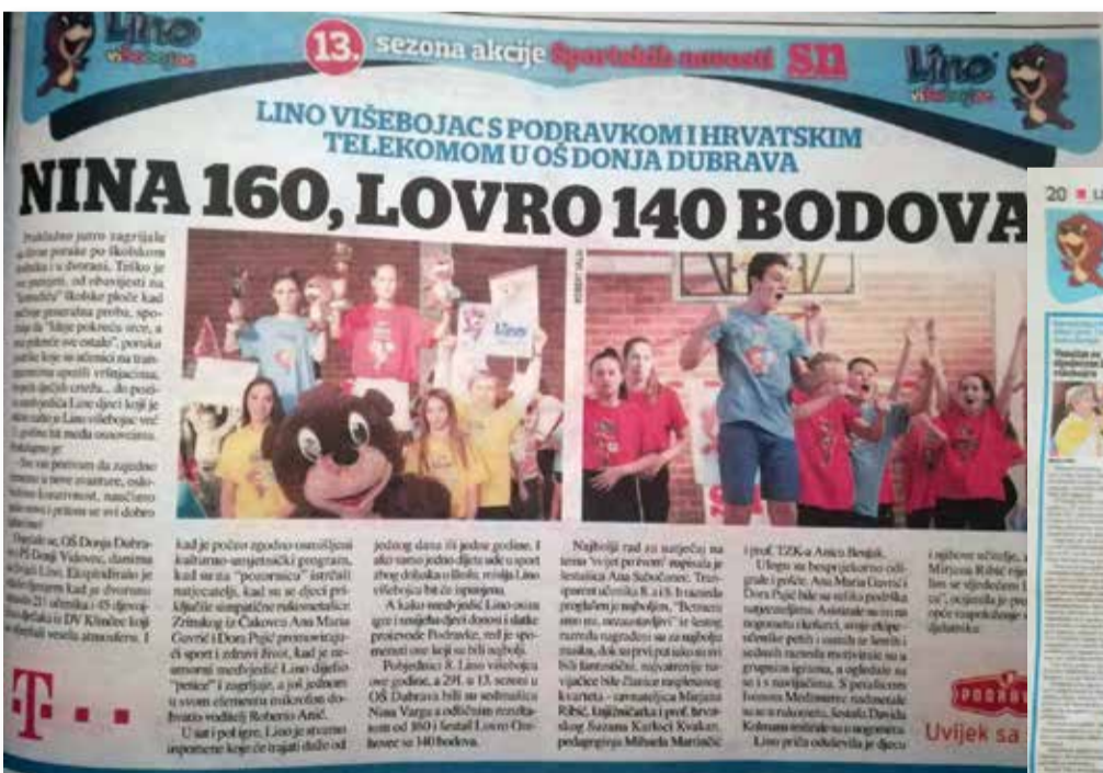
Povodom održavanja Lino višebojca, naša je škola bila predstavljena u hrvatskim dnevničkim novinama Jutarnji list i Sportske novosti.