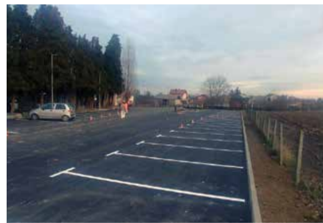
Parkiralište ispred groblja

No što se groblja tiče, tu će biti još puno posla oko sređivanja imovinsko-pravnih odnosa. Naime, prostor groblja predstavlja niz katastarskih i gruntovnih čestica koje nisu u vlasništvu Općine, pa će njih trebati rješavati u sudskim postupcima.