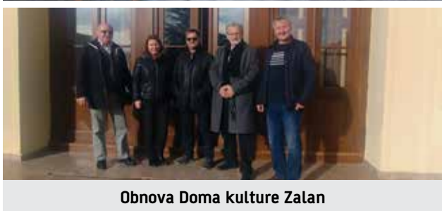
Obnova Doma kulture Zalan