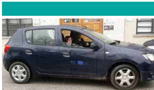
GERO AGE2 – tokom 2018. godine usluge besplatnog prijevoza i pratnje koristilo je čak 14 starijih mještana Donje Dubrave