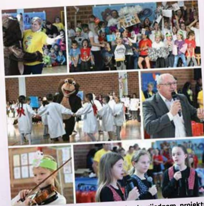
Ugostili smo medvjedića Lino u hvalevrijednom projektu Lino višebojac koji promovira sport, druženje, kreativnost te prave i istinske vrijednosti.