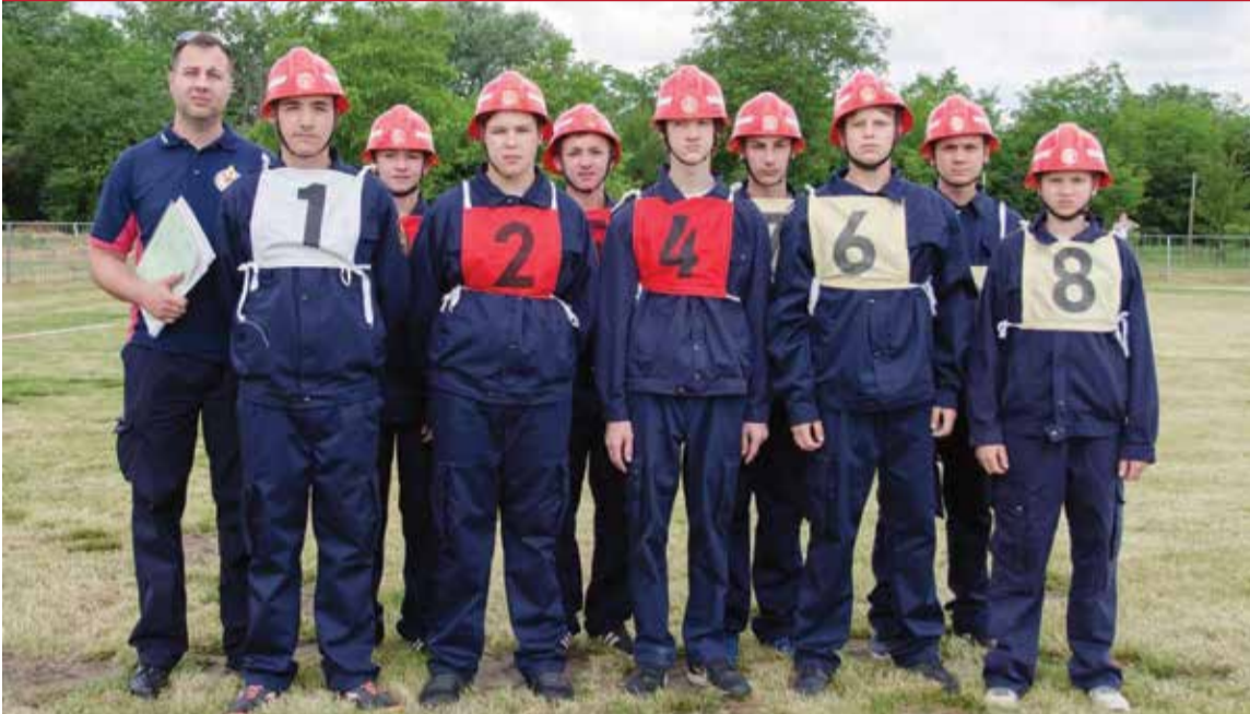
Muška desetina spremna za natjecanje

Na natjecanjima nismo bili previše uspješni, ali smo ponosni na brojnost našeg podmlatka: ove godine, 26. svibnja, na županijskom natjecanju djece i mladeži održanom u Palinovcu bili smo najbrojnija ekipa s gotovo pedeset natjecatelja u četiri kategorije, jednako kao i u Donjem Mihaljevcu gdje smo 17. lipnja nastupili s dvije desetine – jednom muškom i jednom ženskom. Muška se desetina natjecala i u Klani 18. kolovoza ove godine na njihovom, sad već tradicionalnom, Rokovskom natjecanju djece i mladeži.