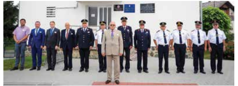
Doček svečanog ešalona pred općinskom zgradom – dio tradicije: vatrogasci dolaze po glavnog pokrovitelja