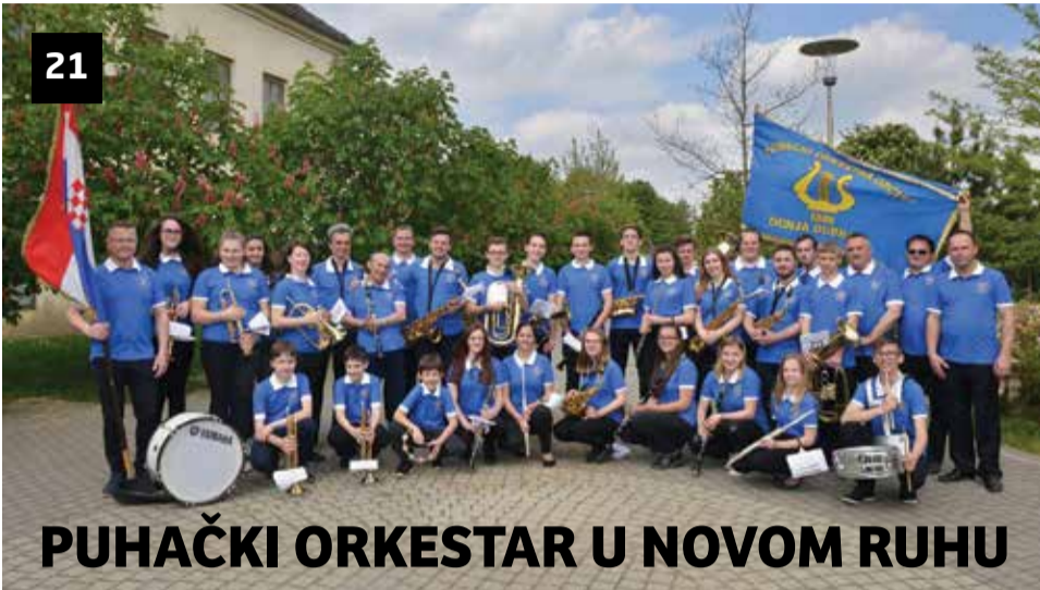
PUHAČKI ORKESTAR U NOVOM RUHU