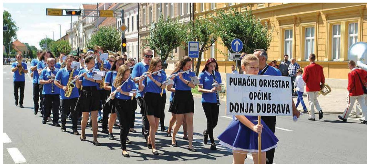
Na smotri u Prelogu

Puhački orkestar općine Donja Dubrava Tekst pisala: Ivana Klarić