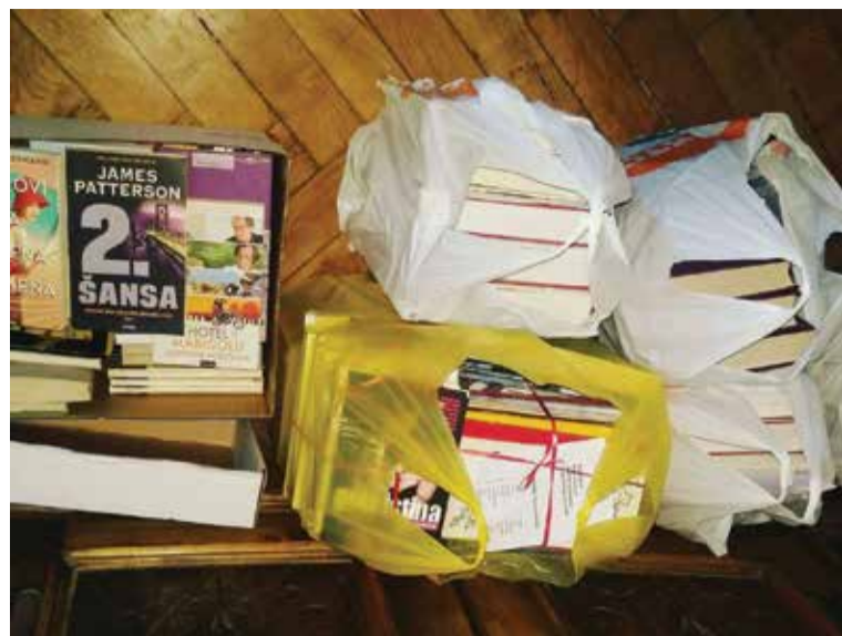
Prve donacije su već primljene! U sve knjige koje su darovane upisujemo ime darovatelja kako bismo im se i na taj način zahvalili na podršci ovom projektu.

Ideju o knjižnici predstavili smo bivšem načelniku Općine Draženu Miseru koji je ideju podržao, a vjerujemo da će se afirmativan stav prema ovom projektu nastaviti i u mandatu sadašnjeg vodstva Općine. U suradnji s Općinom, svim udrugama i pojedincima koji će se htjeti uključiti, osmislilo bi se mjesto gdje će knjige moći biti trajno smještene. Okruženi dobrim, starim mirisom knjiga