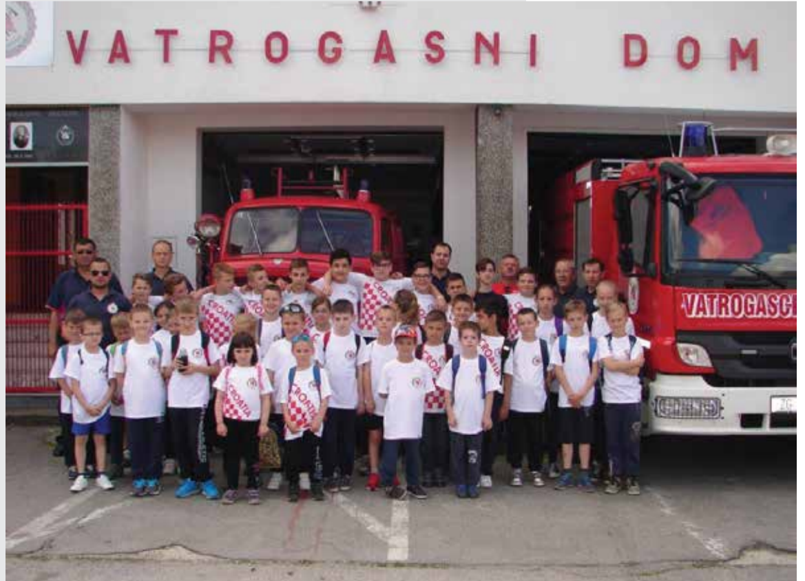
Nikad brojniji pomladak DVD Donja Dubrava

Svima njima, a ponajviše roditeljima i njihovoj djeci (našim najmlađim natjecateljima) najljepše zahvaljujemo na razumijevanju i pomoći u našem radu te se nadamo i daljnjoj ovako uspješnoj suradnji.