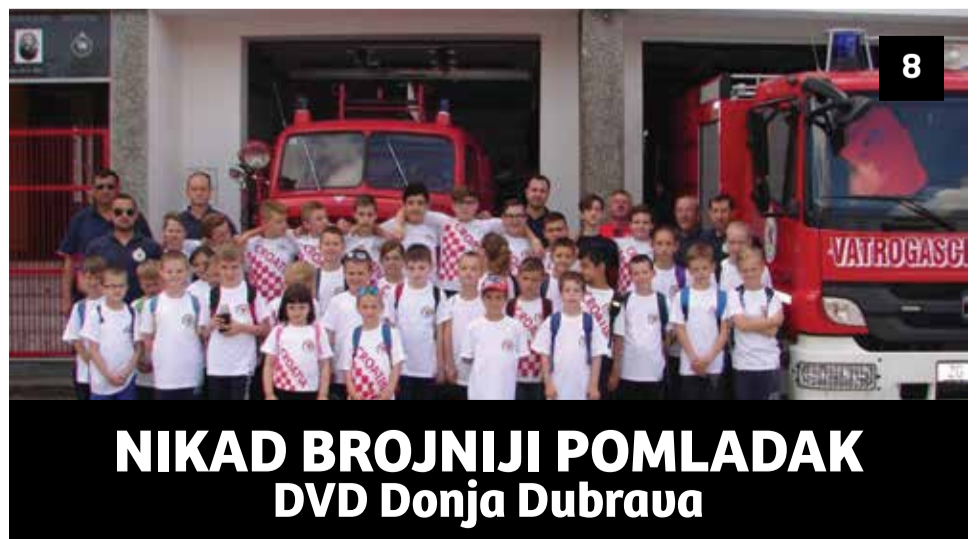
NIKAD BROJNIJI POMLADAK DVD Donja Dubrava