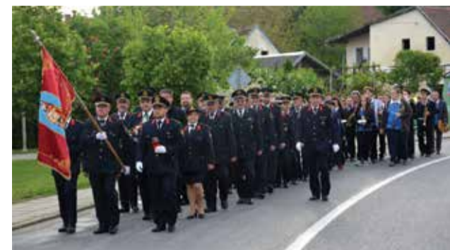
Mimohod s vatrogascima za blagdan sv. Florijana

Osim navedenih nastupa imali smo i neke ostale aktivnosti pa smo tako za potrebe orkestra nabavili i jedan novi instrument – tenor bariton. Što se tiče daljnjih planova, uz naše nastupe u općini i okolici, planiramo i dvodnevno gostovanje u Republici Austriji. Pozivamo sve zainteresirane za uključivanje u rad orkestra da se jave predsjedniku ili profesororu.