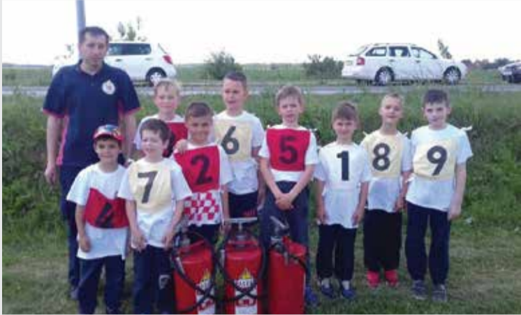
Muški natjecatelji sa Županijskog natjecanja

No najvažnije su nam aktivnosti oko natjecanja djece (starosti od 6 do 12 godina) i mladeži (od 12 do 16 godina). Tako smo 27. svibnja sudjelovali s 4 desetine (dvije mladež – muški; jednom desetinom djece – muški i jednom desetinom djece – žene) na Županijskom natjecanju djece i mladeži održanom u Domašincu.