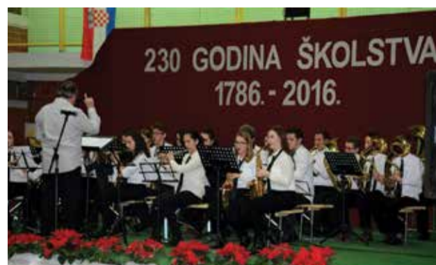
Uveličali smo 230 godina školstva u Donjoj Dubravi