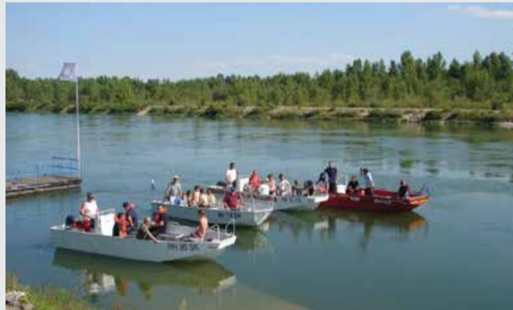
Zajednička vježba s četiri čamca

Nastavak dana protekao je u zajedničkom druženju u prostorima SRD „Štuka“ Donja Dubrava. No nije to bilo samo druženje, već i prilika da naši članovi s položenim ispitom za voditelje brodice dodatno usavrše vještinu upravljanja čamcem za spašavanje. Ovu priliku iskoristili su članovi DVD Donji Vidovec te pripadnici Javne vatrogasne postrojbe grada Koprivnice i Vatrogasne zajednice Koprivničko-križevačke županije za zajedničku vježbu sa svojim čamcima za spašavanje. Sama je vježba iskorištena i za turističke vožnje (sa sva četiri čamca) svih nazočnih u kojima su, kao što se i očekivalo, najviše uživali naši najmlađi članovi.