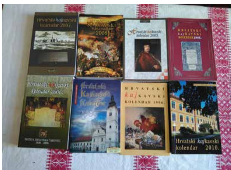
Jedan od ciljeva knjižnice je istraživati lokalnu povijest u čemu će zasigurno ovakva literatura biti od velike pomoći (dio ostavštine Dragutina Šafara)

crvenog luka koji prodaju na okolnim proštenjima i da mjesto ima – razvijenu čitalačku publiku. U godini ove velike obljetnice, u obitelji Kovač (ili Grivčevima,