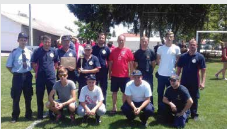
Seniorska ekipa s natjecanja u Donjem Mihaljevcu

U istom su se mjestu 22. lipnja natjecale i dvije naše seniorske ekipe (muška A i muška B) na natjecanju zajednice područja s vatrogasnim motornim štrcaljkama, a muška B ekipa plasirala se na Županijsko natjecanje koje se održalo u Dunjkovcu.