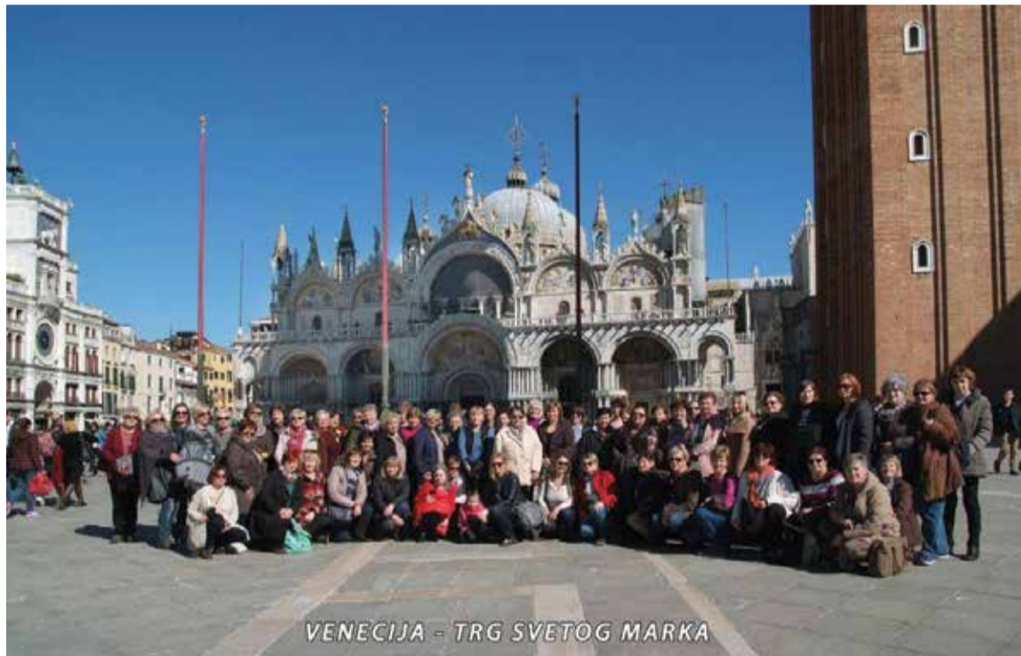
VENECIJA - TRG SVETOG MARKA

57 uživalo je u jedinstvenim prizorima venecijanskih kanala s gondolama, prekrasnim trgovima i palačama. Drugi dan izleta bio je namijenjen sajmu cvijeća u Pordenoneu. Razgledale smo i sam centar grada s lijepom katedralom sv. Marka i na kraju Ortogiardino, sajam cvijeća, raslinja, sadnica i hrane, sve zanimljivo za naše „ženske oči“. Na povratku kući imale smo odmor u Trojanama uz večeru i nezaobilazne dobro poznate fine i velike „trojanske krafne“.