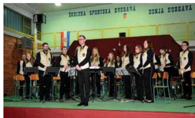
Božićni koncert - Pihalni orkestar Murska Sobotica