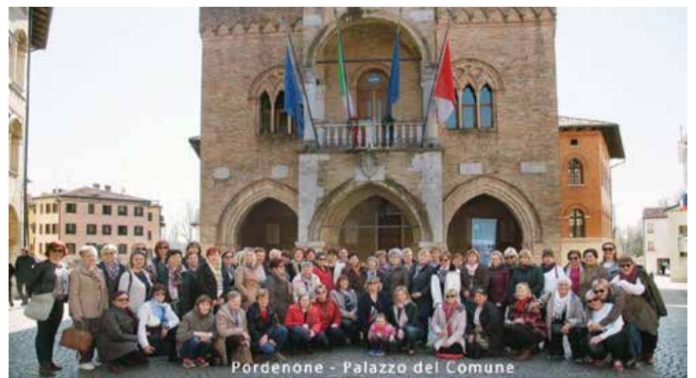
Pordenone - Palazzo del Comune