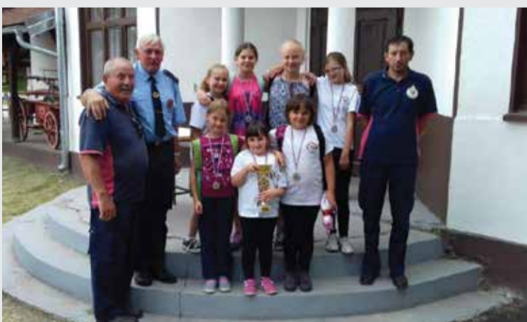
Dio ženske ekipe s natjecanja u Kuzmincu

Dan nakon toga (11. lipnja) na natjecanju Kup Donjeg Mihaljevca sudjelovali smo s dvije desetine (djecu – muški), a vrijedno je spomenuti i dva natjecanja održana istog dana (17. lipnja) u Nedeljancu-Preknu (mladež – muški) i Kuzmincu (djecu – žene) gdje su obje naše ekipe osvojile druga mjesta i svojim kućama ponijele medalje i pehare.