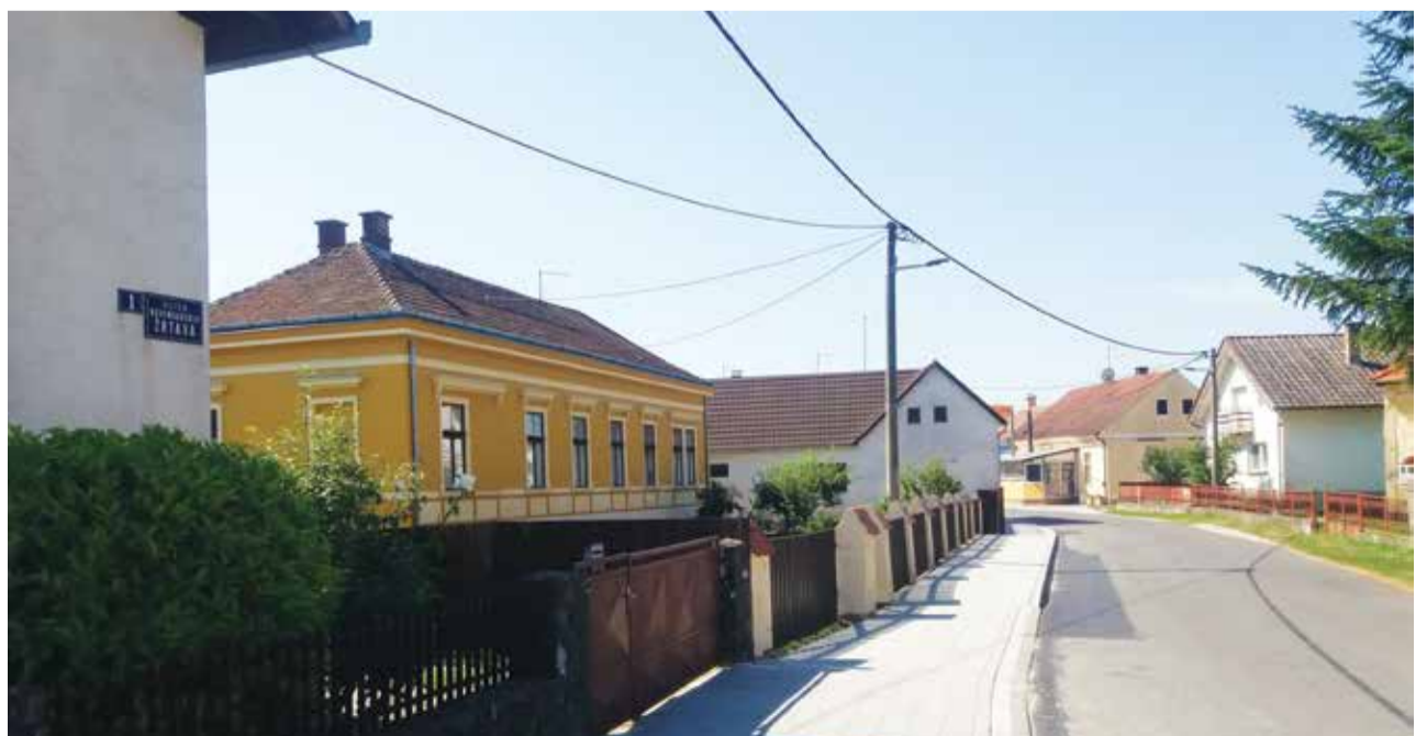
Sedam Dobravčana streljano je 5. studenoga 1918. pred hrpom cigle u središtu Donje Dubrave