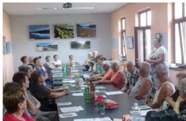
Krajem srpnja Klubovi za starije osobe otvorili su svoja vrata i u Donjoj Dubravi

Osim toga tu ima i umirovljenika s vrlo malim prihodima.