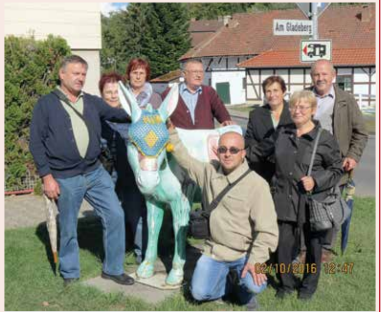
Zajednička fotografija u Hardegsenu

Suradnju s prijateljskim društvom iz Hardegsena nastavili smo i ove godine. Od 29. rujna do 3. listopada petoro je naših članova bilo u prijateljskom