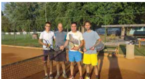
Finalisti Turnira slučajnih parova