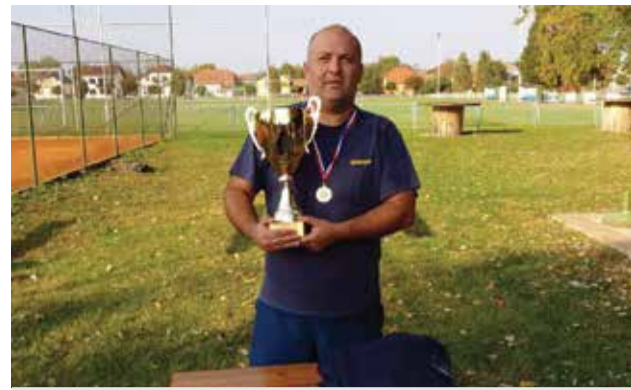
Pobjednik Piramide s prijelaznim peharom