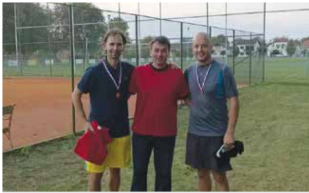
Pobjednici Turnira slučajnih parova