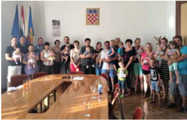
Podjela dara za novorođene

na samom početku ovo božićno vrijeme najljepše je započeti viješću da smo u prvom dijelu godine brojniji i „bogatiji“ za desetero novorođene djece čijim je roditeljima uručena naknada Općine, dok je do izdanja ovog broja Dobravskih novina rođeno još petero djece.