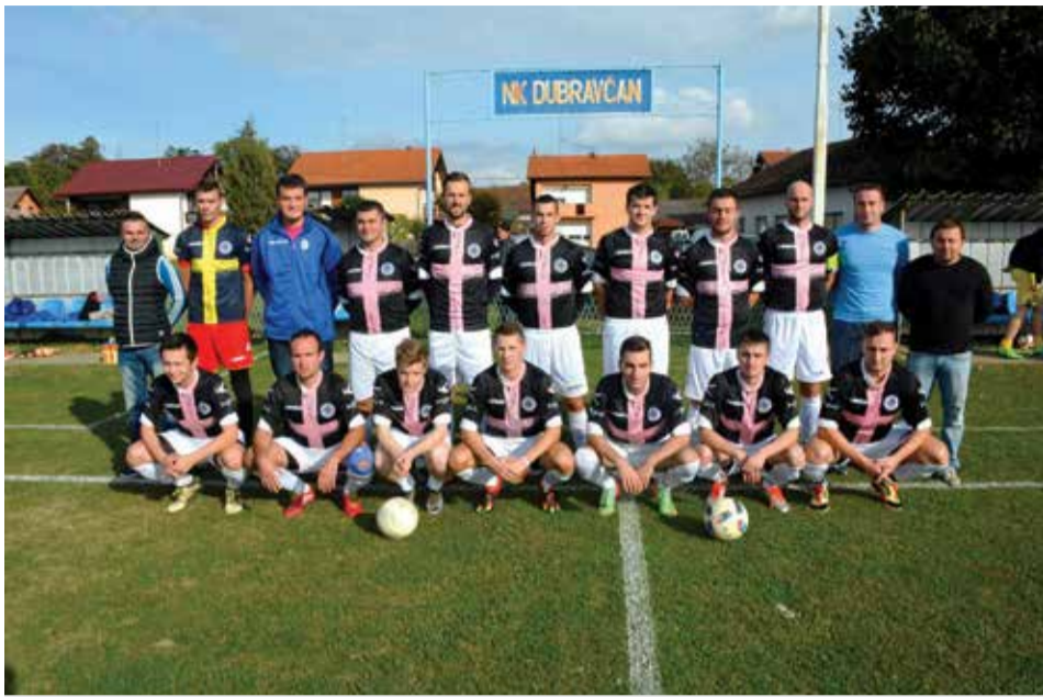
Seniori u novim dresovima