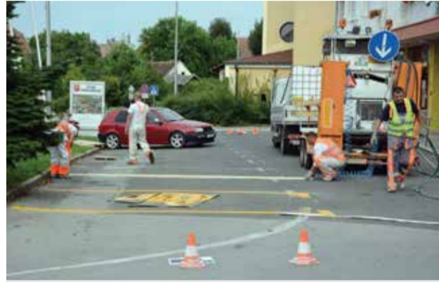
Isrcrtavanje horizontalne signalizacije

Zbog potreba parkinga sve većeg broja automobila širih dimenzija u odnosu na protekla razdoblja, a na zahtjev mještana, na općinskom parkiralištu u centru mjesta isrcrtana je nova horizontalna signalizacija koja će omogućiti lagodnije parkiranje svim korisnicima okolnih poslovnih objekata te su obnovljeni pješački prelazi kao i crte u ulicama koje su vlasništvo Općine. Vrijednost radova iznosila je 9.603 kuna.