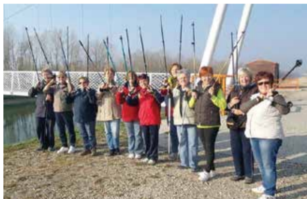
Članice Kluba za starije osobe na Nordijskom hodanju uz Dravu (Norijsko hodanje)

Usluge pruža stručni tim Centra za pomoć u kući Međimurske županije