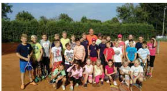
Sudionici Škole tenisa