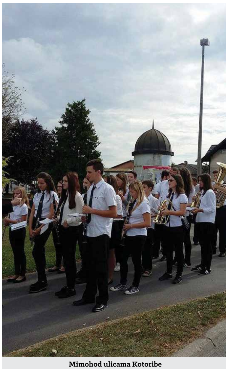
Mimohod ulicama Kotoribe

Ovim vas putem želimo pozvati na već tradicionalni Božićni koncert koji će se održati 26. prosinca u dvorani Osnovne škole Donja Dubrava. Ove godine gosti će nam biti Pihalni orkestar iz Murske Sobotice.