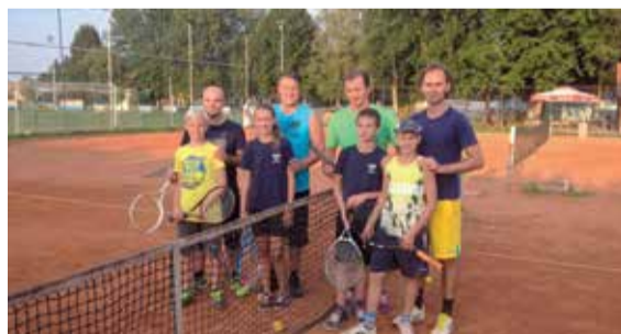
Finalisti revijalnog turnira roditelji-djeca