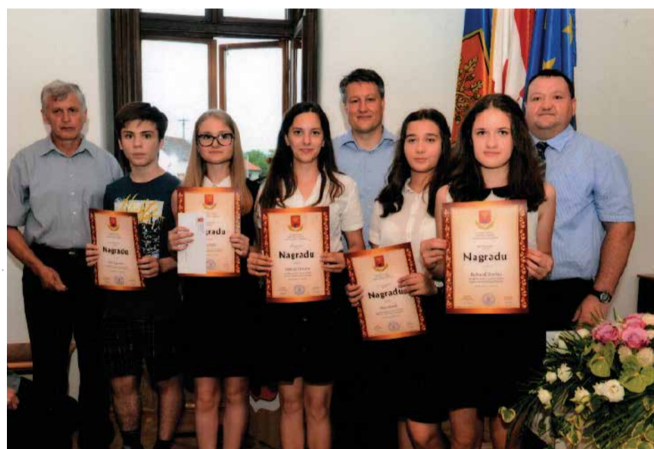
Naši najbolji osmogodišnji odličaši