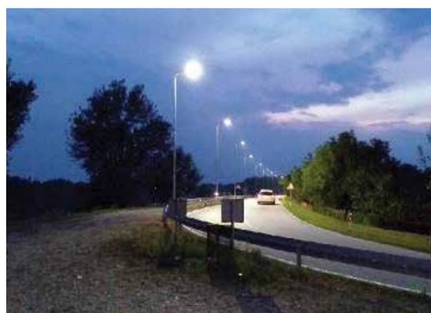
Izgrađena javna rasvjeta nastavak Drava po projektu „Izgradnja javne rasvjete za sigurniji promet“ koje sufinancira MGIPU

Dani ljuka manifestacija je Općine koja je ove godine, 28. kolovoza, održana jubilarni deseti put te je kao takva zasigurno jedan od značajnijih događaja u našoj županiji ovog desetljeća. Broj od 45 izlagača te velik broj posjetitelja dokaz su upravo tome da se odradila izvrsna priprema, a sveukupno zadovoljstvo dodatni nam je poticaj za organizaciju iste u narednim godinama.