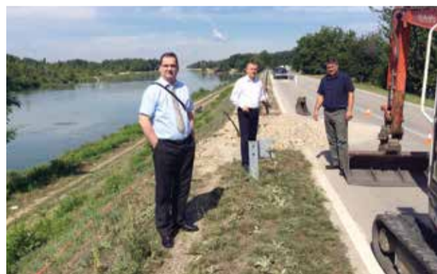
Pomoćnik ministra graditeljstva i prostornoga uređenja Milan Rezo u obilasku radova koje sufinancira Ministarstvo

Radove na izgradnji 2. kolovoza 2016. godine obišao je pomoćnik ministra graditeljstva Milan Rezo.