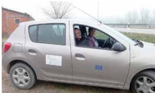
Uslugu besplatnog prijevoza do liječnika koristi nekoliko osoba iz Donje Dubrave