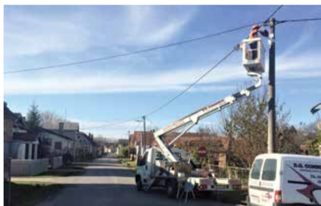
Radovi postavljanja LED rasvjete

Cijeli projekt pod nazivom „Energetski učinkovito u svijetlu budućnost – 1. faza” s 500.000,00 kuna sufinancira Ministarstvo regionalnog razvoja i fondova EU potpisan od strane ministra Tomislava Tolušića, a Općina je pokrila ostatak od 130.386,13 kuna do ukupnih 630.386,13 kuna. Trg Republike, Novembarskih žrtava, M.P. Miškine, Zagrebačka, Matije Gupca, Braće Radić, Podravska, Koprivnička i Krbulja ulice su s novom rasvjetom dok se očekuje raspisivanje novih natječaja gdje namjeravamo kandidirati 2. fazu za ostale ulice.