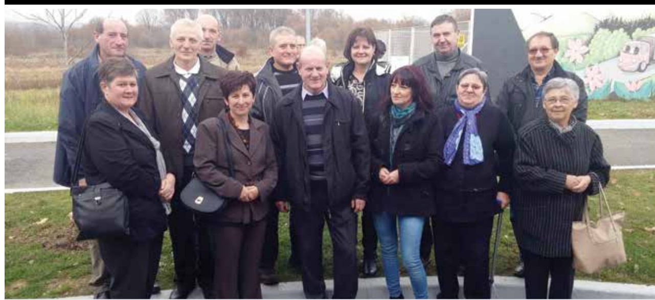
KLA OSMIJEH iz Donje Dubrave na putu prema Zagrebu na održavanje večeri poezije

Naš Klub liječenih alkoholičara djeluje već 20 godina. Budući da nam se godina bliži kraju, red je da se i mi osvrnemo na naš minuli rad. Želja nam je obavijestiti čitatelje Dobravske novine o aktivnostima Udruge u proteklom razdoblju.