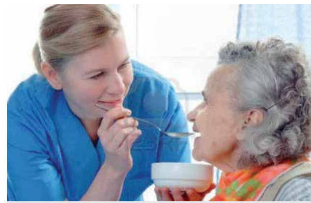
Ruka pomoći a u očima zahvalnost

Cijena usluge pomoći u kući je 50,00 kuna po satu usluge. Ta usluga obuhvaća: čišćenje i pospremanje (pranje, glačanje, mijenjanje posteljine, usisavanje...), odlazak u nabavu te plaćanje računa i slične usluge, pomoć u osobnoj higijeni, pomoć kod hranjenja i odijevanja, kontrola i nabava lijekova, izmjera šećera u krvi i krvnog tlaka, podrška pri ostvarivanju prava korisnika, pratnja liječniku (osiguran prijevoz Centra).