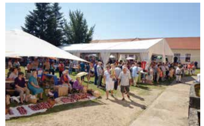
10. dani ljuka i ekološke proizvodnje

Vežano uz temu eko-proizvodnje, volio bih se nadovezati i jednom viješću kojom će možda biti oduševljeniji mlađi naraštaji kad za nekoliko godina preuzmu od nas očuvan okoliš. Naime, Općina Donja Dubrava s ostalim susjednim općinama i gradom Prelogom od strane Ministarstva zaštite okoliša i prirode primila je godišnju nagradu za dostignuća u zaštiti okoliša.