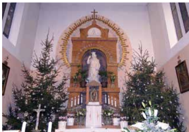
radost za sav narod! Danas vam se u gradu Davidovu rodio Spasitelj – Krist, Gospodin... (Lk 2,10)

Bog se jednostavno objavio Isusovim rođenjem u betlehemske štali da veličanstvenost ne bi ljude udaljila od Boga, dok ih u jednostavnosti i skromnosti uvijek privlači k sebi. Bog po svojim anđelima objavljuje najčudesniji događaj riječima mira: Ne bojte se! Evo javljam vam blagovijest, veliku