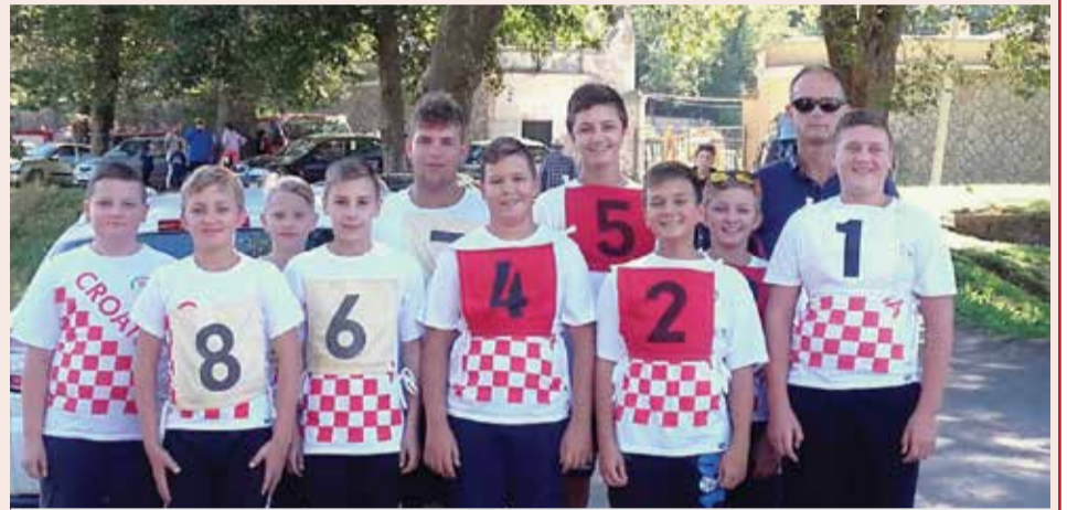
Naši mladi natjecatelji u Klani su osvojili 2. mjesto

posjetu gradu Hardegsenu. Uz druženje i razgled grada i okolice, naši su članovi zapalili svijeće na grobu našeg počasnog člana Alojza Čižmešije.