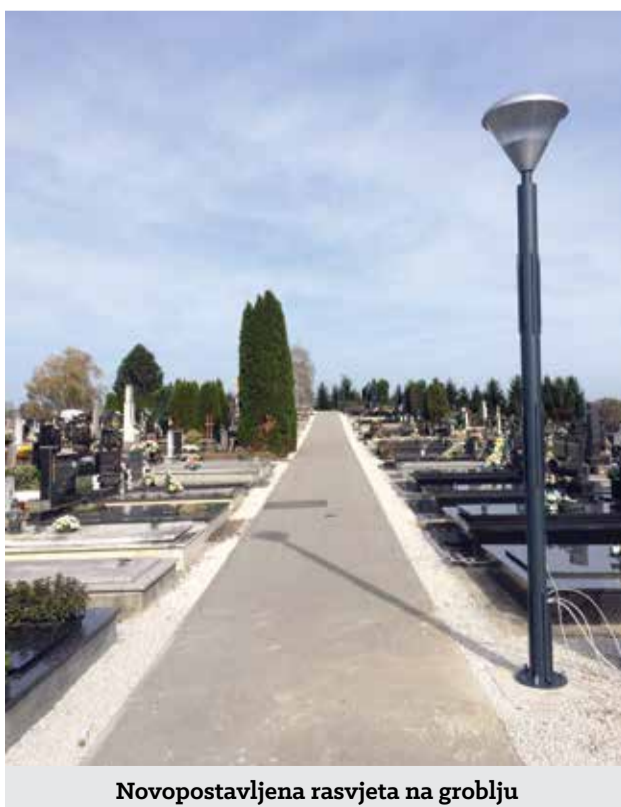
Novopostavljena rasvjeta na groblju

Postava bankomata HPB-a uistinu nije mala stvar s obzirom na to da banke sve više izbjegavaju mala ruralna mjesta. To je i dodatna potvrda da treba preferirati hrvatske proizvode i subjekte s kojima je moguć dogovor za suradnju, a s ciljem boljih usluga lokalnoj zajednici.