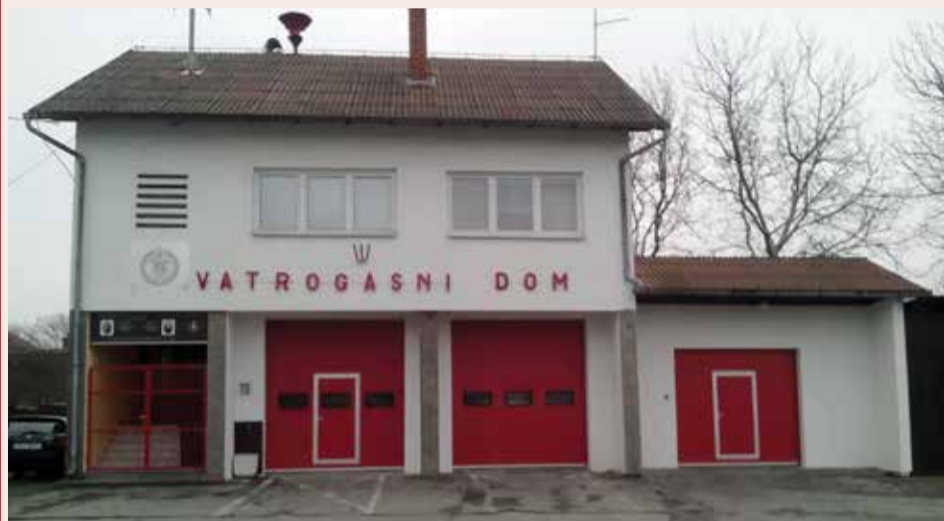
Nova garažna vrata