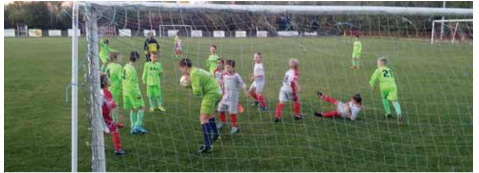
Početnici u žaru borbe

Ostaje nam žaljenje jer nijedna od udruga u našem mjestu nije nastavila tradiciju održavanja Seoskih igara. U više navrata probali smo nešto poduzeti, ali nitko nije imao za to sluha. I dok smo kao organizatori uvijek nailazili na neke kritike, sad je bila