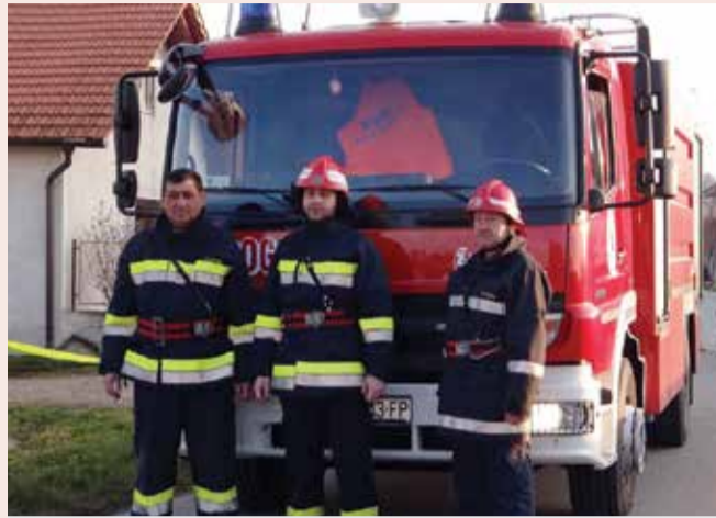
Na javnoj pokaznoj vježbi

Natjecateljsku godinu završavamo, već tradicionalno, u Svetoj Mariji i Klani. Na natjecanju sa sprežnim