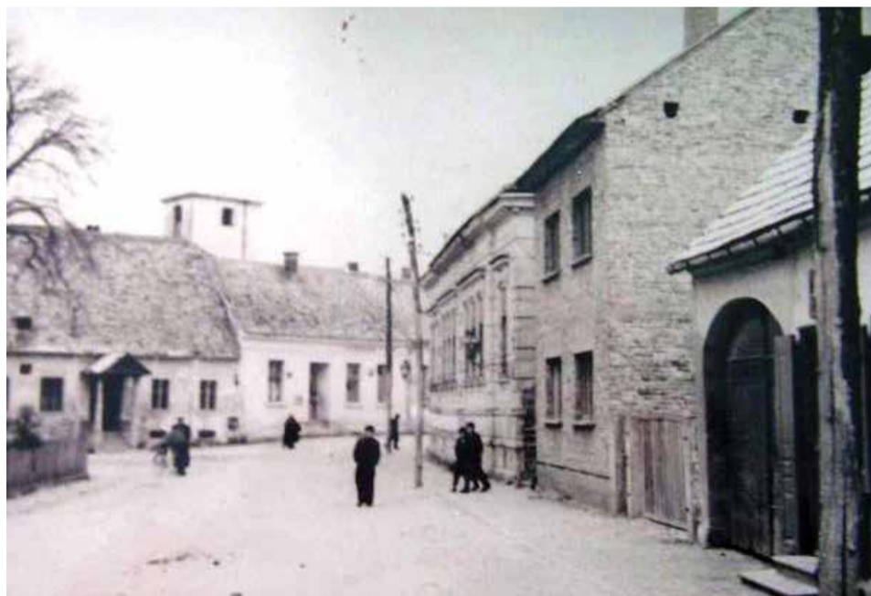
Dobravski pijac negda

Autor slavnog romana „Doživljaji dobrog vojaka Švejka“ lutao početkom 20. stoljeća Međimurjem i Podravinom