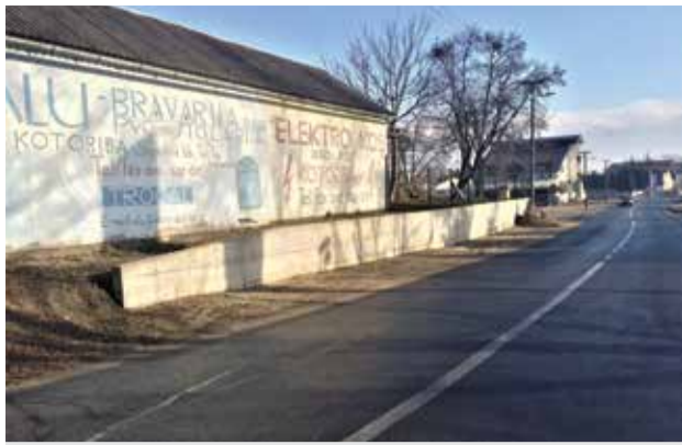
Potporni zid u Koprivničkoj ulici

Projekte pripremamo prema mogućim natječajima. Na isti način spreman je i projekt rekonstrukcije dijela nerazvrstane ceste (Pažut) u dužini od 765,56 metara nastavka asfalta prema Muri i to ne zato jer se nekom prohtjelo, nego zato što su uvjeti financiranja 90% od strane fonda, a to je ujedno i jedina cesta koju zaobilazi izgradnja kanalizacije.