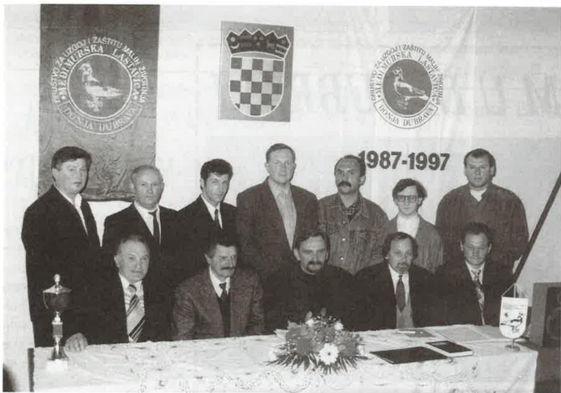
Članovi predsjedništva društva "Međimurska lastavica" na svečanoj skupštini održanoj 15. III. 1997.

Ove godine, 15. ožujka, održana je Deseta, jubilara, godišnja skupština. Okupilo se 60-ak članova i uzvanika. Nakon pozdravnog govora predsjednika Đure Zvošca uslijedila su izvješća s područja poslovanja i rada svake od sekcija, a potom i blagajnika, te skladištara. Predsjednik je iznio plan rada društva za tekuću godinu. Tu se, uz ustaljene aktivnosti (organiziranje dviju izložaba, sudjelovanje na državnoj izložbi, održavanje Dana Međimurske lastavice), ističe plan izgradnje vlastitog, samostojećeg skladišta i sudjelovanje na jednoj od većih europskih izložaba.