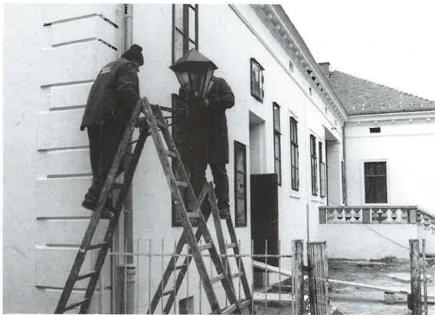
Obnova stepeništa i rasvjete na zgradi "Zalan"

sve. Naime, zbog vremenskih prilika, poslovi nisu obavljani do kraja. Nije izvršeno drugo bojanje pročelja zgrade, pa se primjećuju neosušeni dijelovi. Ti poslove morati će se napraviti na proljeće kad nastupe odgovarajući vremenski uvjeti, tada će se obojiti i balustrade na ulaznom stepeništu. Uz pročelje obnavlja se i unutarnji dio hodnika gdje je žbuka ispucala, te se ista struže i nanosi novi sloj. Cijeli posao vodio se pod nadzorom Konzervatorskog odjela u Varaždinu, koji je davao upute na sve naše primjedbe i prijedloge, a njih je bilo od jednolične boje fasade, pločica na ulaznom stepeništu, vanjskih svjetiljki i slično.