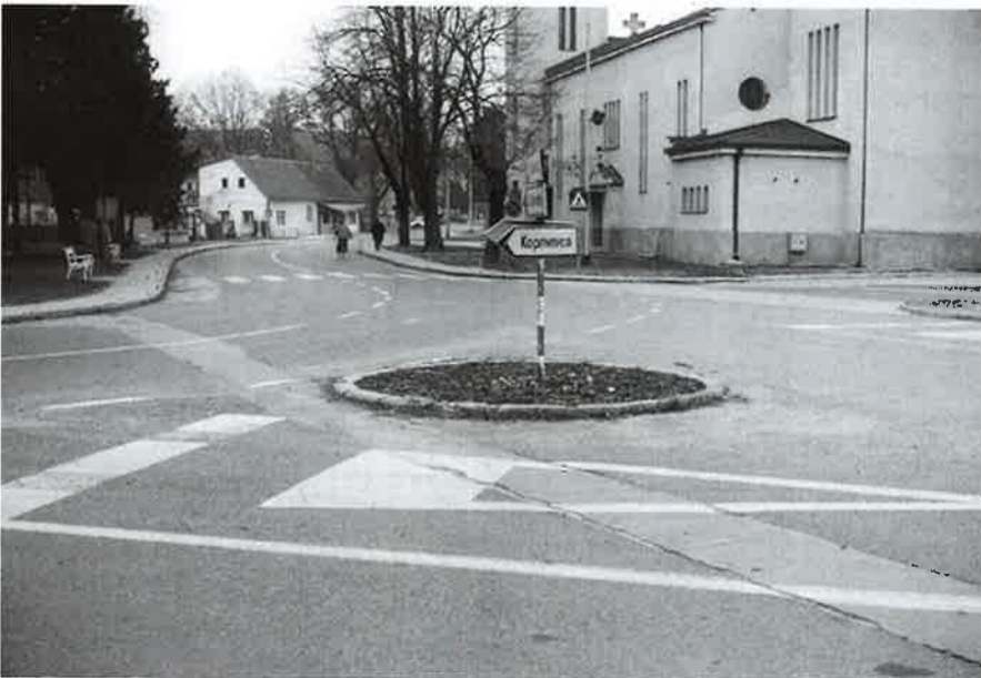
Obnova horizontalne signalizacije centra

S predsjednikom Udruženja Pomurskih općina za regionalni razvoj Istvánom Tislérom, temeljem u veljači potpisanog Sporazuma o suradnji, potpisan je ugovor o partnerstvu za projekt gospodarske suradnje u održavanju Obrtničkih sajмова, pomoć u suradnji srednjih strukovnih škola kroz predstavljanje na Obrtničkim sajmovima, te razvoju turističke djelatnosti.