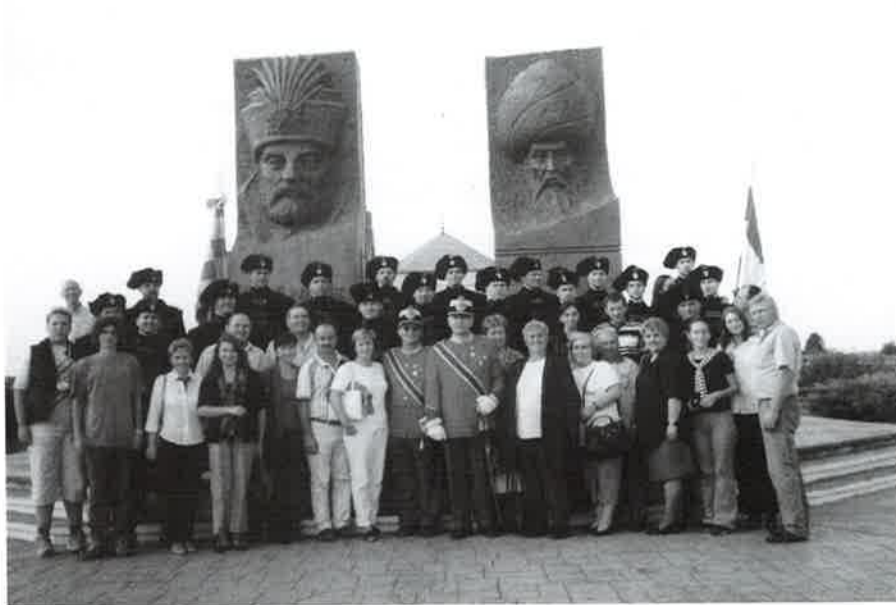
Općinska delegacija u mađarskom gradu Szigetvaru povodom obljetnice pada grada sa Zrinskom gardom

Oko aktivnosti na uređenju mjesta i na groblju čitati ćete u drugim člancima.