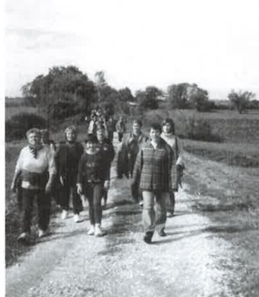
Pješačenje na Novi Zrin

Povodom svjetskog dana pješačenja upriličile smo uz pomoć Općine i drugih udruga pješačenje