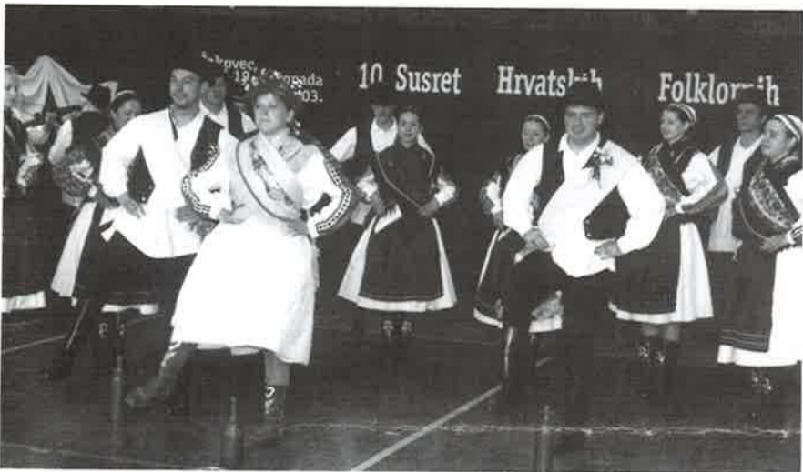
Nastup na državnoj smotri u Čakovcu

«Zimske su nam doge noći, nije nje prespati moći...» pjeva pjesma, a mi ćemo u tim dugim zimskim noćima i dalje vježbati – i pjevati i plesati, a i svirati (možda se nađe kakva dobra duša pa nam