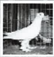
Udruga uzgajivača malih životinja Medimurska lastavica Donja Dubrava

Cijenjenim čitateljima Dobravske novine na kraju ove 2003. godine u ime članova Udruge uzgajivača malih životinja «Medimurska lastavica» upućujem srdačne pozdrave i želim vam ukratko prezentirati aktivnosti udruge u 2003. godini.