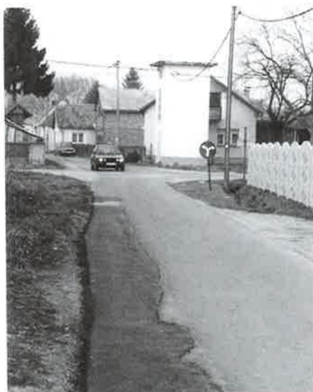
Popravak udarnih rupa

Od iduće godine imati ćemo organizirani odvoz komunalnog otpada, a biti će potrebno i sanirati divlje odlagalište otpada. Konačno je pred dovršenjem i Plan prostornog uređenja Donje Dubrave, koji ćete imati na uvidu, te dati svoje prijedloge. Od iduće godine naše sportske udruge predstavljati će se s Dobravskim grbom, za što je u proračunu izdvojeno 15.000 kuna.