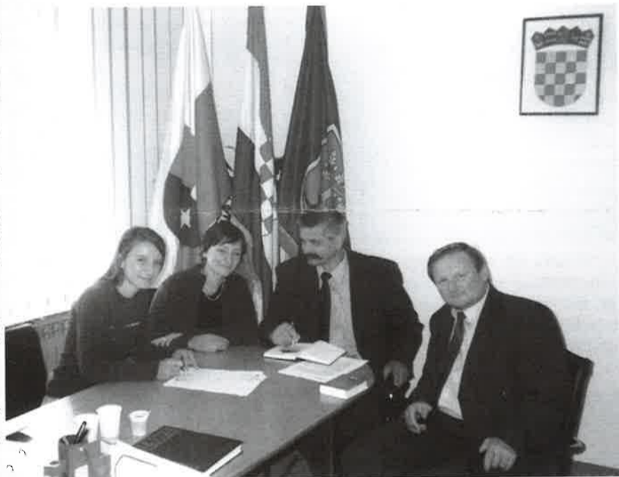
Potpisivanje Ugovora o partnerstvu s mađarskim partnerima