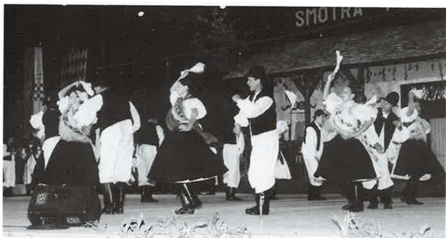
Nastup na "Vinkovačkim jesenima" koji je prenosila HTV

Iz Sotina, mjesta na Dunavu, na samoj granici, u susretu s ljudima koji su iskusili sve strahote domovinskog rata: pucnjavu, logore, rušenje i uništavanje, te žalost za najmilijima o kojima ni danas ništa ne znaju, svatko je od nas duboko u srcu odnio nezaboravne uspomene. Riječima se sigurno ne mogu opisati svi osjećaji koji naviru kad nakon dugih godina strahota, mržnja i žalost ustupi mjesto pjesmi, plesu i veselju. Rekli bismo da je život ponovno «oživio».