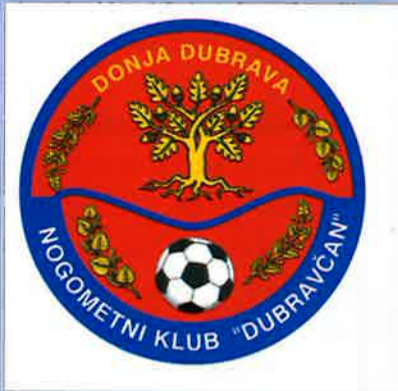
NOGOMETNI KLUB "DUBRAVČAN"