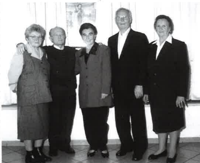
Slavljenici 50 godina braka 28. XI. 2003.