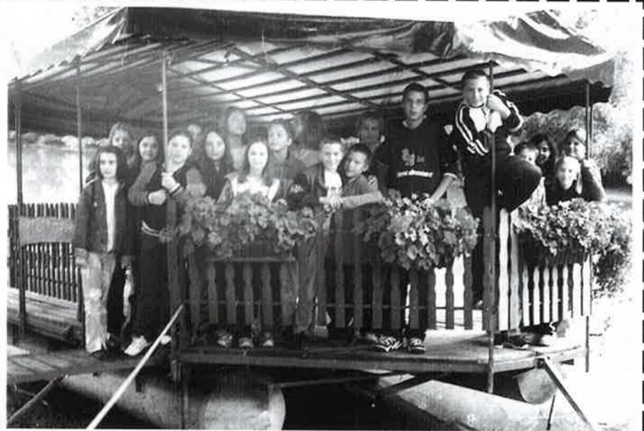
Odmor na obali Dunava