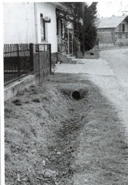
Obnova površinske kanalizacije

Sagledavajući ovu 2003. godinu, smatram da je bila vrlo uspješna te posebno dinamična i naporna, što se vidi po proračunu koji je do sada najveći. Smatram da između ostalih zaslugu za to imaju moji svakodnevni suradnici Ivan