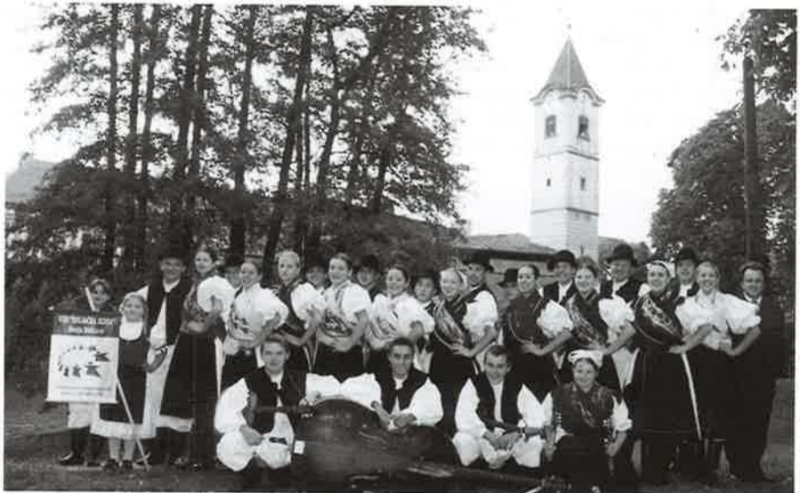
Sudionici na Državnoj smotri koreografinog folkloru

Na ovoj smotri nastupalo je 12 amaterskih kulturnih društava iz cijele Hrvatske te je svako društvo prvi dan trebalo izvesti pjesme i plesove svog kraja, a drugi dan jednu