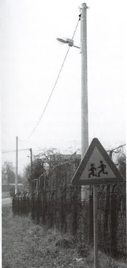
Montaža javne rasvjete u ulici Krbulja

U sklopu Euro-regijskih projekata zatražena je pomoć u Ministarstvu pomorstva prometa i veza, održan je razgovor o mogućnosti dobivanja nepovratnih sredstava za obnovu skele «Zrinski».