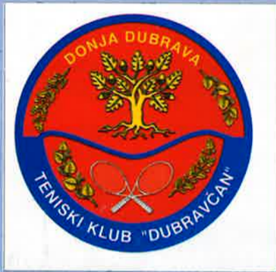
TENISKI KLUB "DUBRAVČAN"