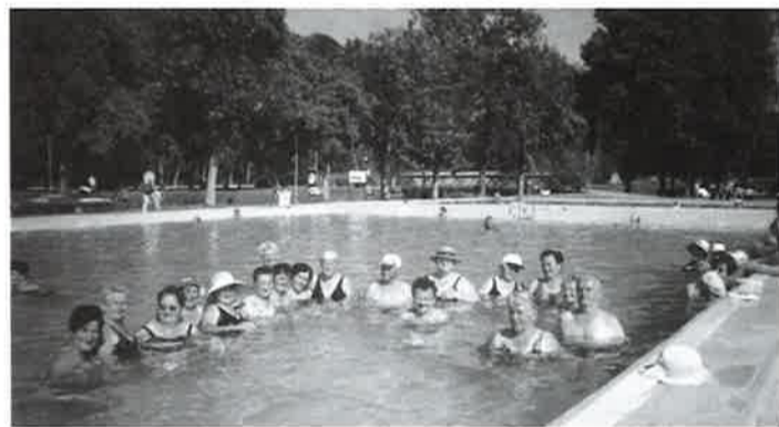
Umirovljenici u Stubakima 2003.

Podružnica Vratišinec također nas je pozvala na zabavno-sport- ski susret. Bili su oduševljeni