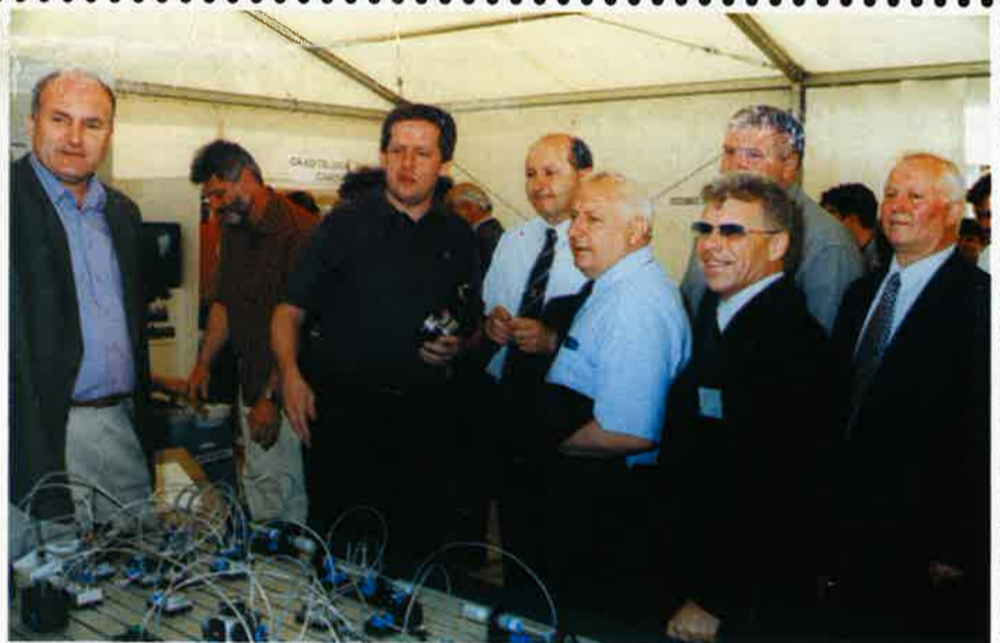
Predstavnici političkog i gospodarskog života Medimurske županije

Na inicijativu Udruge i Općine 9. XII. održan je sastanak s trgovcima Donje Dubrave. Tema je bila «Zakon o