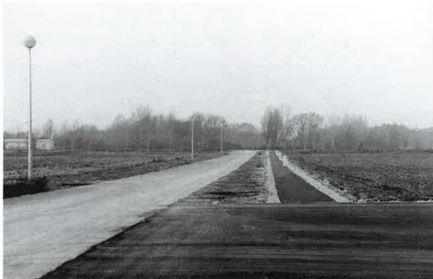
Javna rasvjeta i pješačka zona u maloj privredi

Obzirom na opsežnost ovog zahvata, u ovoj prvoj fazi izrade projekta turističke zone u D. Dubravi održan je radni dogovor s direktorom HE Dubrava