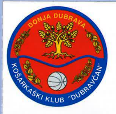
KOŠARKAŠKI KLUB "DUBRAVČAN"