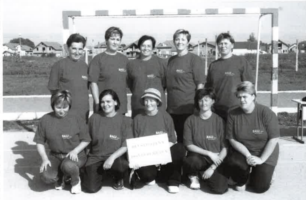
Ekipa Udruge žena Donje Dubrave koja je sudjelovala na Festivalu sportske rekreacije žena Međimurske županije u Prelogu