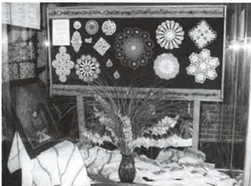
Izložba ručnih radova - ulaz na izložbu

I za kraj, sudjelujemo u organizaciji božićnih darova za djecu do četvrtog razreda. Darovi će se dijeliti u Sv. Margareti na Božić, za blagoslov djece, poslije prigodnog programa.