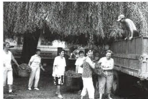
Jesensko čišćenje dvorišta Zalan