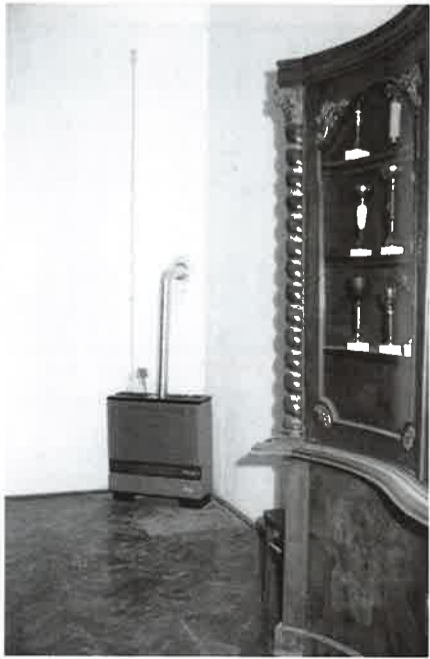
Uveden je plin u zgradi "Zalan"