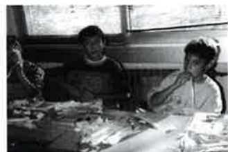
Živi dokaz da su muške ruke jednako spretno kao i ženske

Po riječima voditeljice Nade Bogojević interes za naše radove bio je velik ponajviše zbog njihove jednostavne