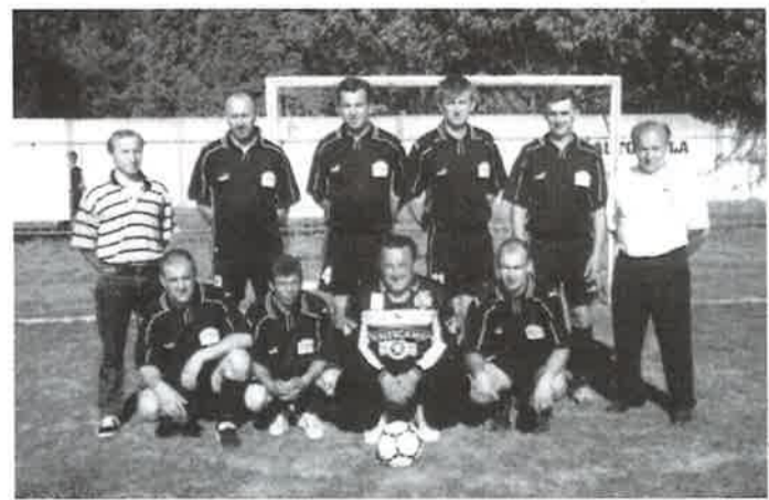
Svim članovima udruge i svim mještanima Donje Dubrave želimo puno sreće i zdravlja u 2004. godini.

Kao i prethodnih godina, i ove godine je organizirana podjela darova djeci članova udruge na originalan način: Djed Mraz je djecu obišao na kolima vučenim konjem posjetivši svako dijete i osobno mu predavši poklon.