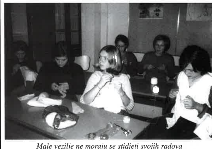
Male vezilje ne moraju se stidjeti svojih radova

A za sljedeću godinu članovi zadruga najavili su nam još novih projekata, ali nisu htjeli reći o čemu se radi. Naravno, tada to i ne bi bilo iznenađenje. Poznajući njih i njihov rad, vjerujemo da će biti uspješni!