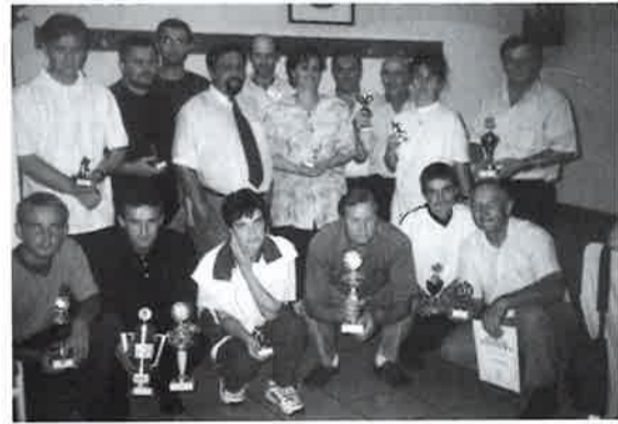
Nagrađeni na otvorenom prvenstvu D. Dubrave 1999.

Otvoreno prvenstvo D. Dubrave održano je u tri dana u 5 kategorija: registrirani igrači, neregistrirani igrači, kadeti, veterani i žene.