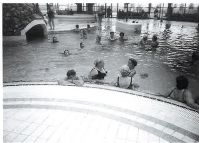
Bizovačke toplice 1999. godine

Pošto naši umirovljenici najviše vole izlete u toplice te