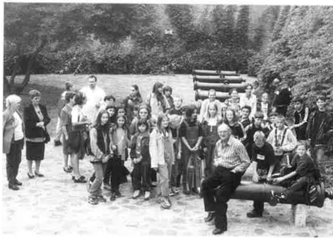
Za spomen na posjet Győru - zajednička fotografija na obali Mošonskog Dunava