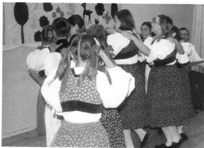
Našim domaćinima u Bizonji predstavili smo se plesom, pjesmom i glazbom