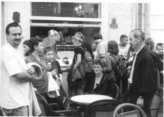
Šetnja ulicama Győra bila je ugodnija uz sladoled i malo osuženjeje u "Mocartovoj slastičarnici"