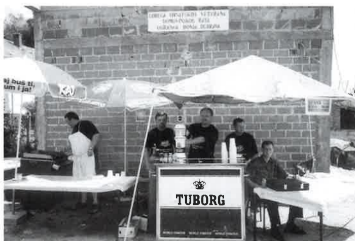
Članovi udruge na radnom zadatku "Margaretsko proštenje" '99.

Svim svojim članovima kao i mještanima Donje Dubrave Blagoslovljen Božić