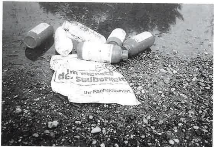
Ljudi delajo bormastoče ...

nek nas je Bog posadil tu, vu tem je mesto, vu na dalko znani Dobravi, bilo fnogo več ljudi nek je denes. Te so ljudi znalji kak treba živeti, te so ljudi melji svojo kultu-