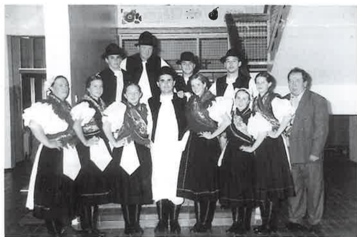
Prvi nastup novih plesača

mjeseci. Odlučili smo uz pomoć Općine ponovno prelakirati parket u našoj prostoriji i tako s novim "glancem" započeti pripreme za završetak godine. Čekala nas je priredba na kojoj su nastupala tri društva: KUU "Zvon" iz Male Suboti-