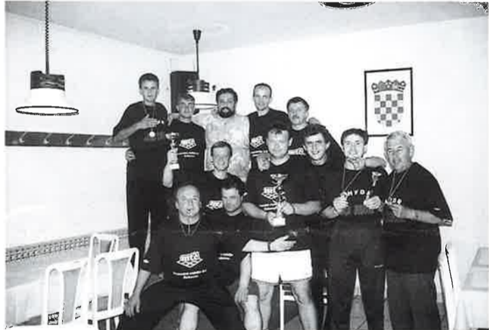
Sa županijskog natjecanja 2. mjesto

- organiziranje posjeta članova Udruge bojištima sudjelovanja domicilnih postrojb.