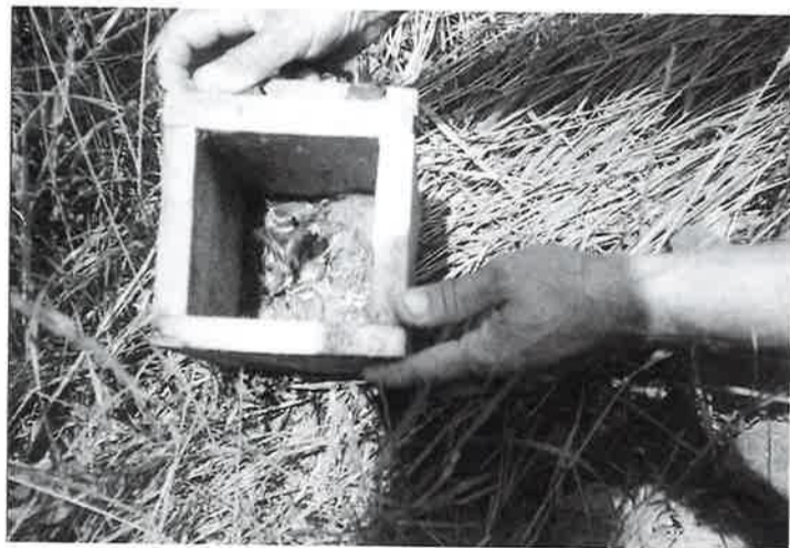
i još k tomo naprajimo nekaj več!

tati. Ili v hudomo ilji v dobromo nam je retko što raven. Dok se poljitičari svade i nemrejo dogovoriti moremo biti srečni kaj smo pa-