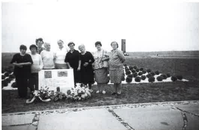
Vukovar, Ovčara 1999. godine