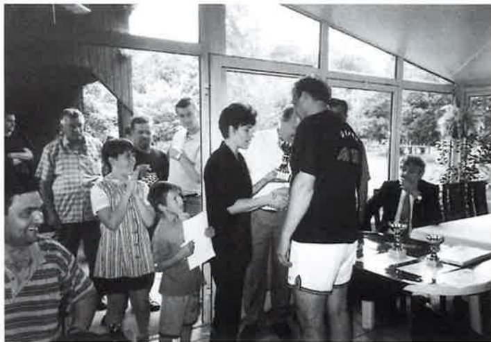
Dodjela nagrade za 1. mjesto memorijalnog turnira "Dragutin Friščić-Kesera" u Donjem Vidovcu kolovoza '99.

Obilježnice i svečanosti - čuvanje spomena na poginule hrvatske branitelje s područja Općine uz financijsku potporu Općine, kojoj se