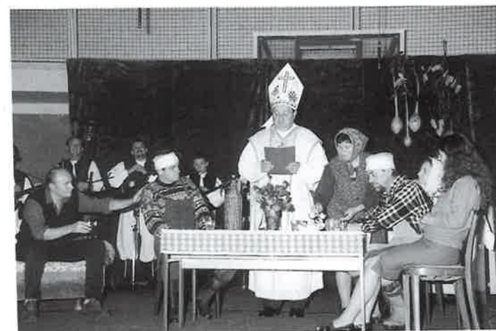
"Dragi moštek ja te krstim"

Na toj priredbi obećali smo mještanima da ćemo za Martinjicu organizirati priredbu. Svoje obećanje smo i ispunili. Na