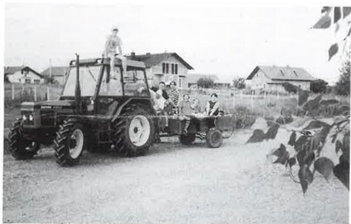
Mi to počistimo ...

Ljepja moja, Dobrava zeljena, retko što ti je do koljena. Je sikak se to more zgrun-