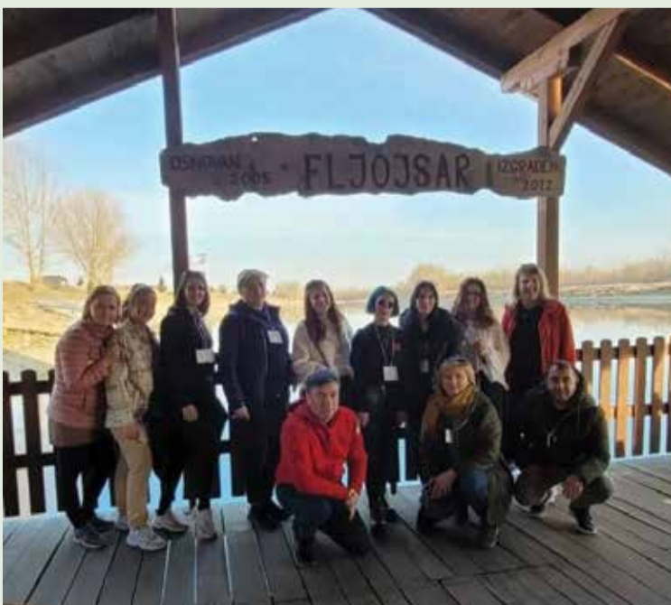
Učitelji na fljojsu