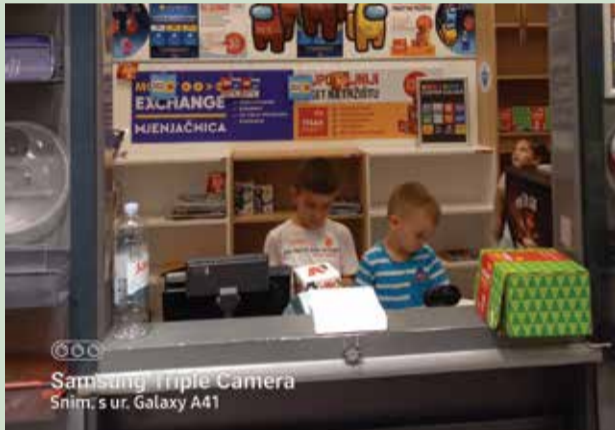
Samsung Triple Camera Snim. s ur. Galaxy A41