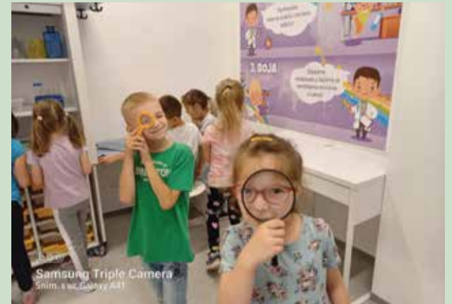
Samsung Triple Camera Snim. s ur. Galaxy A41

Dječji vrtić je od prošlog javljanja radio punim tempom. Zimske mjeseci proveli smo u igri, šetnjama te raznim aktivnostima po skupinama.