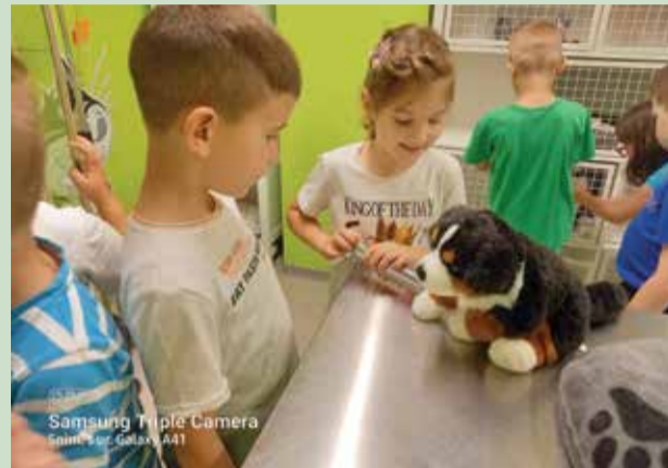
Samsung Triple Camera Snim. s ur. Galaxy A41