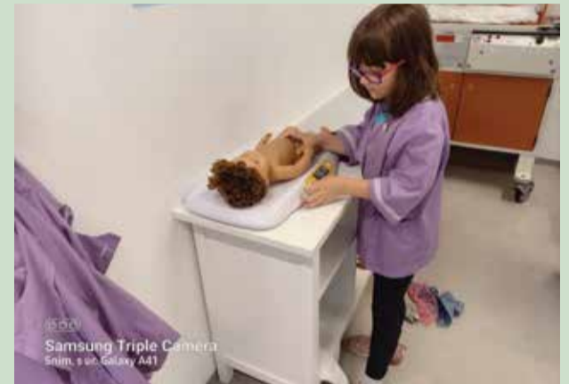
Samsung Triple Camera Snim. s ur. Galaxy A41