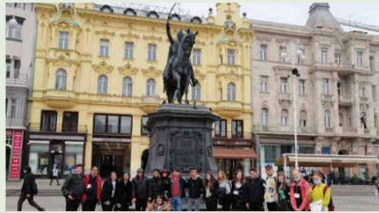
Izlet u Zagreb

prostorima škole provedene su radionice upoznavanja i izrade loga projekta, a poslije podne bilo je rezervirano za upoznavanje ljepota naše Dobrave šetnjom uz Dravu. Učitelji škole domaćina pripremili su QR kodove pomoću kojih su učenici mogli naučiti nešto više o posebnostima Donje Dubrave kao i obogatiti svoje znanje engleskog jezika. Osim što su imali priliku razgledati Fljojs na Dravi, najveće veselje učenicima