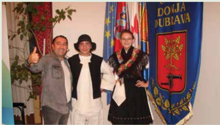
Gosti u dobričkoj nošnji

Tjedan ispunjen druženjima i edukativnim događanjima, sve je sudionike projekta obogatio novim znanjima, donio nova poznanstva, a i prijateljstva te su se svi vratili u svoje školske