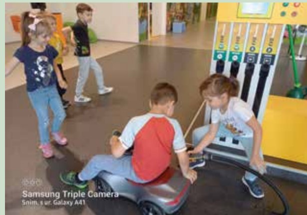
Samsung Triple Camera Snim. s ur. Galaxy A41