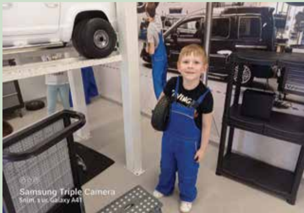
Samsung Triple Camera Snim. s ur. Galaxy A41