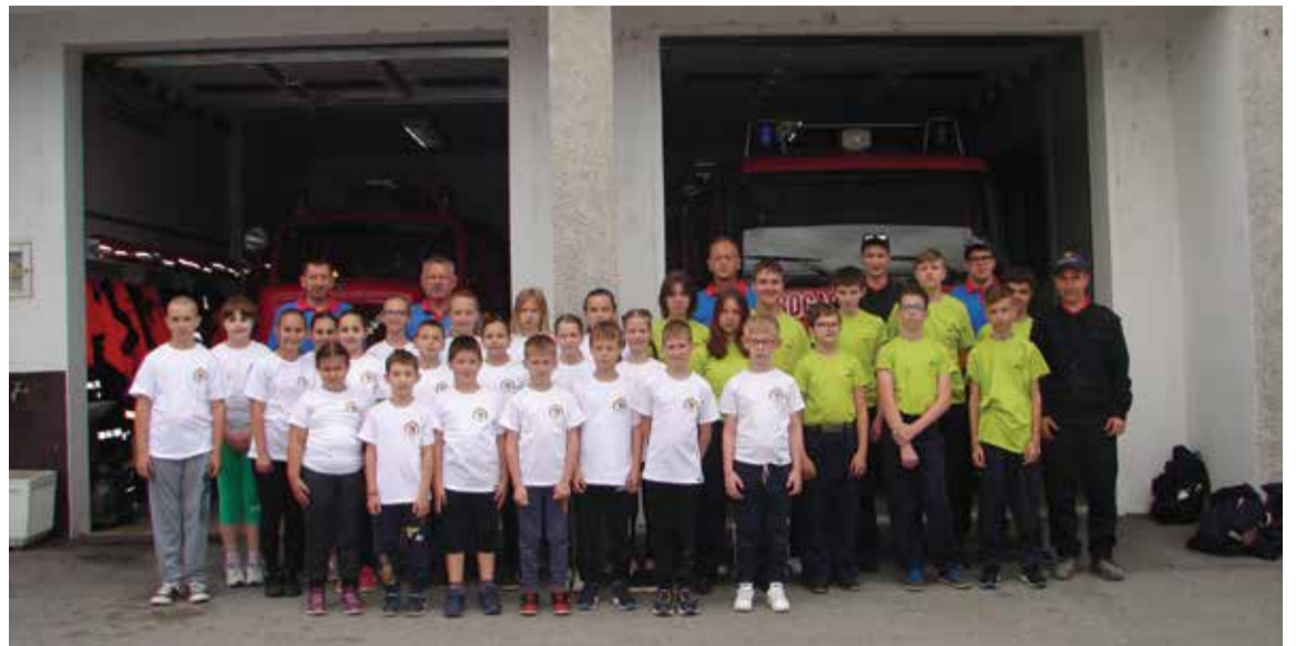
Naši natjecatelji na Županijskom vatrogasnom natjecanju

Ove su godine konačno krenula i natjecanja. Nakon tri sušne godine naši dječaci i djevojčice imali su prilike natjecati se sa