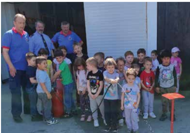
Mališani iz dječjeg vrtića su se okušali i u „pravim“ vatrogasnim vještinama

ugostili smo male polaznike Dječjeg vrtića „Klinčec“ koji su 12. svibnja s velikim zanimanjem razgledali naše prostore i opremu.