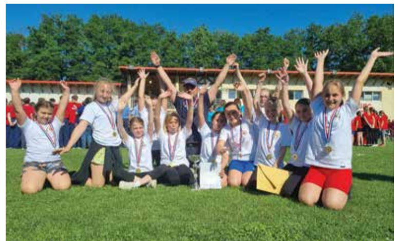
Veselje zbog osvajanja 2. mjesta

svojim vršnjacima iz cijelog Međimurja na Županijskom natjecanju održanom u Šenkovcu 11. lipnja. Tamo smo nastupili s tri desetine: dvije ekipe podmlatka i jednom ekipom mladeži. Sve su ekipe ostvarile dobre rezultate, ali nas je sve ugodno iznenadila najmlađa ženska ekipa koja je u svojoj kategoriji osvojila 2. mjesto . Djevojke, čestitamo!