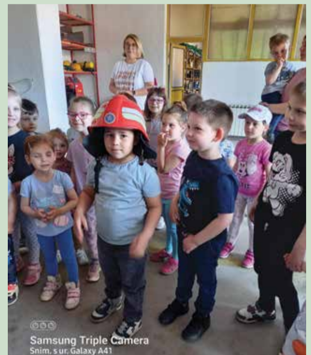
Samsung Triple Camera Snim. s ur. Galaxy A41