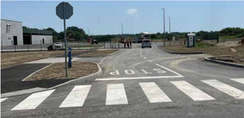
Cesta u gospodarskoj zoni (prema Rekis)

U gospodarskoj zoni obavljen je natječaj za financiranje prilazne ceste do tvrtke „Rekis“ d.o.o., te je odabran najjeftiniji ponuditelj koji je radove izveo za iznos od 331.748,75 kn s PDV-om. Na žalost nadležno Ministarstvo nije raspisalo natječaj za sufinanciranje infrastrukture u gospodarskim zonama tako da cijela investicija pada na teret Općine. No nije nam žao, Dobrava je dobila prekrasnu tvornicu i zato posebne čestitke investitorima.