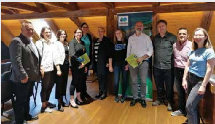
Projekt "Zajednica škola Rezervata biosfere Mura-Drava-Dunav MŽ"

U srpnju 2012. te u rujnu 2021. godine UNESCO je proglasio međudržavni Rezervat biosfere Mura-Drava-Dunav. Na području Međimurske županije njime upravlja Međimurska priroda – Javna ustanova za zaštitu prirode. S ciljem senzibiliziranja javnosti kakav značaj za lokalnu zajednicu i njezino stanovništvo ima ekosustav koji je zbog svoje bioraznolikosti priznat na međunarodnoj razini, kako se prema njemu treba odnositi i kako ga očuvati, Javna ustanova Međimurska priroda inicirala je novi projekt suradnje i umrežavanja svih škola u obuhvatu područja Rezervata biosfere Mura-Drava-Dunav, prije svega s ciljem kvalitetnije edukacije djece i mladih. Nazvan je Zajednica škola Rezervata biosfere Mura-Drava-Dunav na području Međimurske županije. Usmjeren je na školsku populaciju s namjerom približavanja prirode i potrebu njezinog očuvanja, učenicima na aktivan i prikladan način. U prvoj fazi provedbe projekta odabrano je šest međimurskih osnovnih škola koje su već i dosad u svojim aktivnostima dale naglasak na ekologiju, zaštitu prirode i održivi razvoj: Osnovna škola Tomaša Goričanca Mala Subotica, Osnovna škola Mursko Središće, Osnovna škola Domašinec, Osnovna škola Hodošan, Osnovna škola Donja Dubrava i Osnovna škola Orehovica.