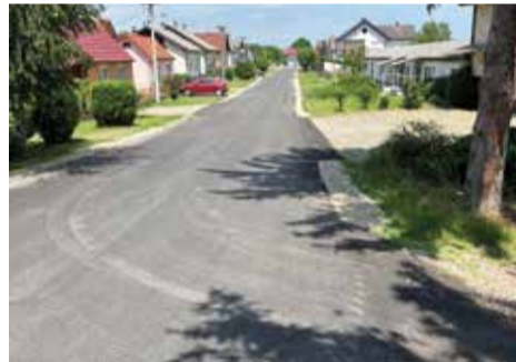
Ulica Vladimira Nazora