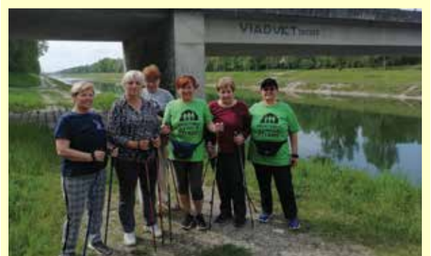
Grupe nordijskog hodanja održavaju se svakog tjedna