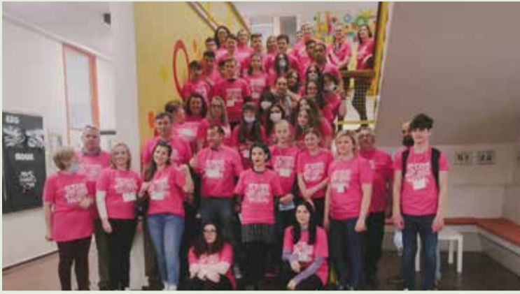
Dan ružičastih majica

U tjednu od 13. do 19. ožujka 2022. godine naša je škola ugostila učenike i učitelje iz Turske i Poljske. Riječ je o školskom partnerstvu u okviru KA210-SCH projekta naziva Beyond Borders: BUDDIES not BULLIES koji se bavi temom vršnjačkog nasilja te poticanju prijateljskih odnosa.