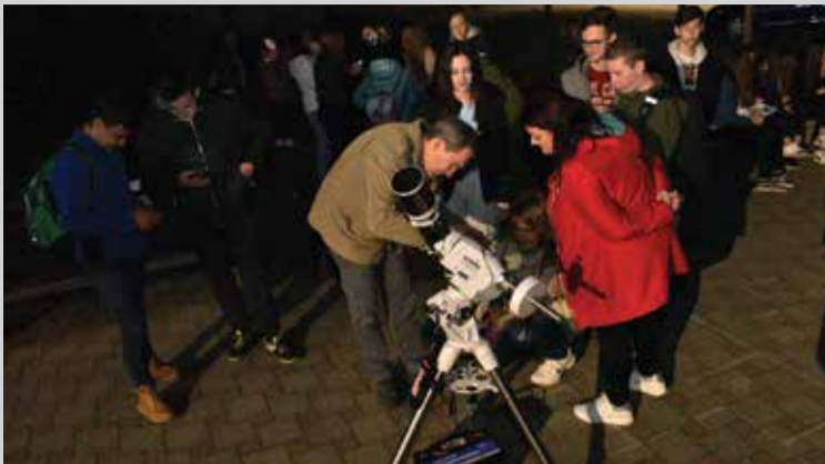
Gledanje noćnog neba

U sklopu projekta "TTEO – Popularizacija STEM-a u Međimurju" članovi i volonteri Astronomske udruge Vega održali su u našoj školi astronomsko promatranje te popratno predavanje. Kako bi sudjelovali u promatranju učenici