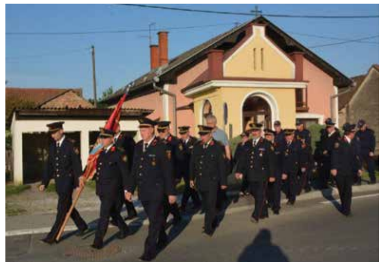
Svečani mimohod i zahvala zaštitniku vatrogasaca sv. Florijanu