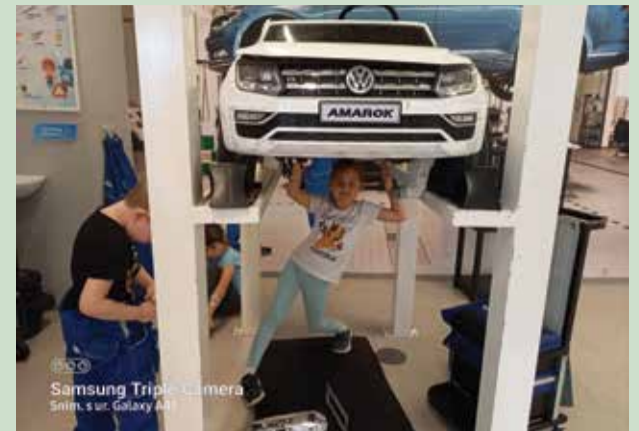
Samsung Triple Camera Snim. s ur. Galaxy A41