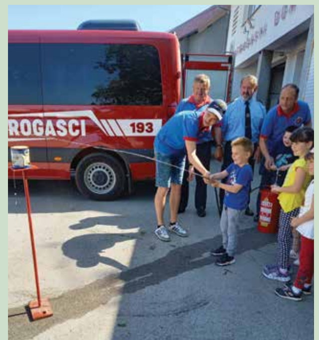
Samsung Triple Camera Snim. s ur. Galaxy A41