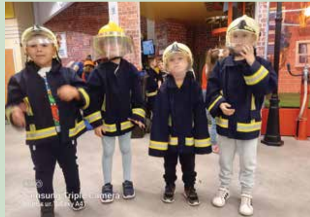
Samsung Triple Camera Snim. s ur. Galaxy A41