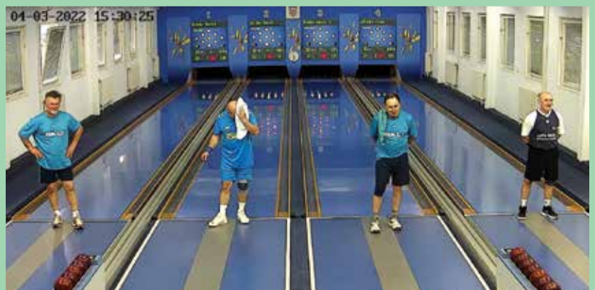
Prvenstvo RH - veterani