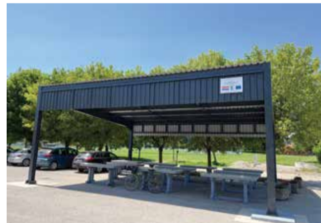
Nadstrešnica na tržnici

Ukupna vrijednost radova iznosila je 281.564,37 kn, od toga je potpora iz proračuna Europske unije iznosila 156.101,55 kn, dok je razliku financirala Općina. Projekt je kompletno završen u mjesecu travnju ove godine.