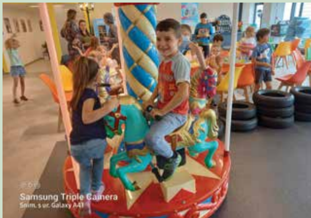
Samsung Triple Camera Snim. s ur. Galaxy A41