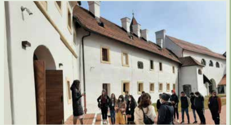
Odlazak u muzej