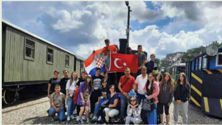
Naši učenici u Poljskoj

prostorima škole provedene su radionice upoznavanja i izrade loga projekta, a poslije podne bilo je rezervirano za upoznavanje ljepota naše Dobrave šetnjom uz Dravu. Učitelji škole domaćina pripremili su QR kodove pomoću kojih su učenici mogli naučiti nešto više o posebnostima Donje Dubrave kao i obogatiti svoje znanje engleskog jezika. Osim što su imali priliku razgledati Fljojs na Dravi, najveće veselje učenicima