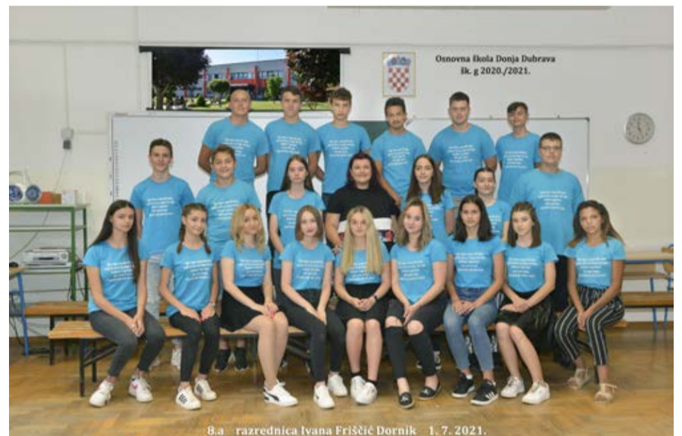
Učenici 8.a razreda