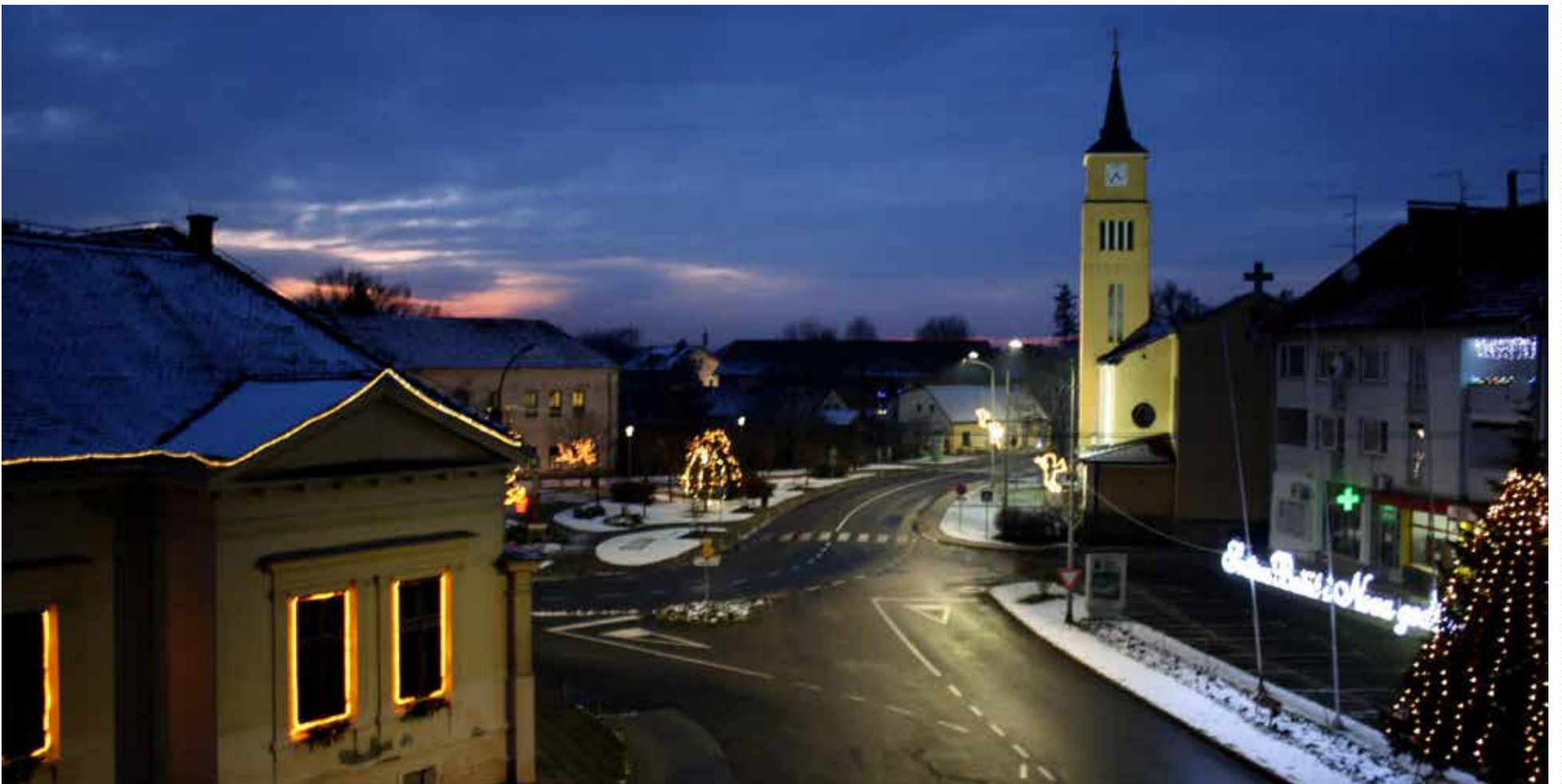
Udruga umirovljenika - podružnica Donja Dubrava