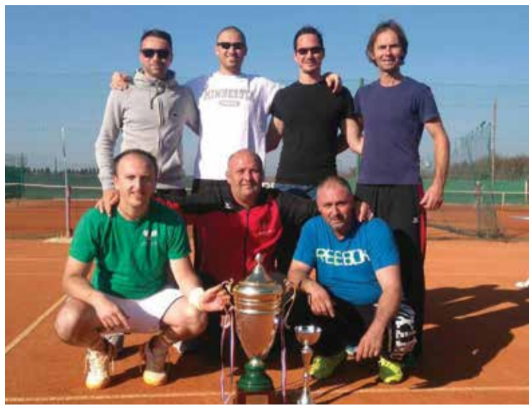
Pobjednici Veteranske lige Međimurja

Potvrdila je to ekipa „Dubravčana-1“ koja je pobijedila u finalu Veteranske lige Međimurja i treći put zaredom postala najbolja veteranska ekipa Međimurja.