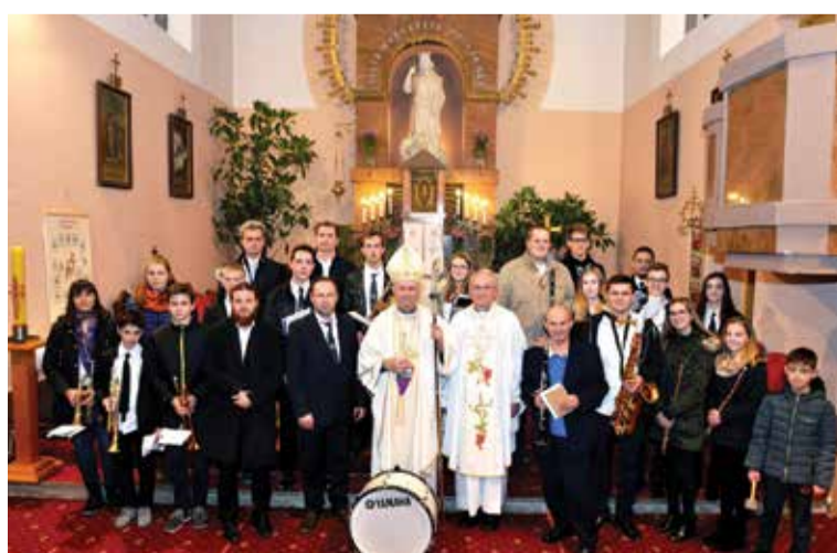
Fotografiranje s biskupom