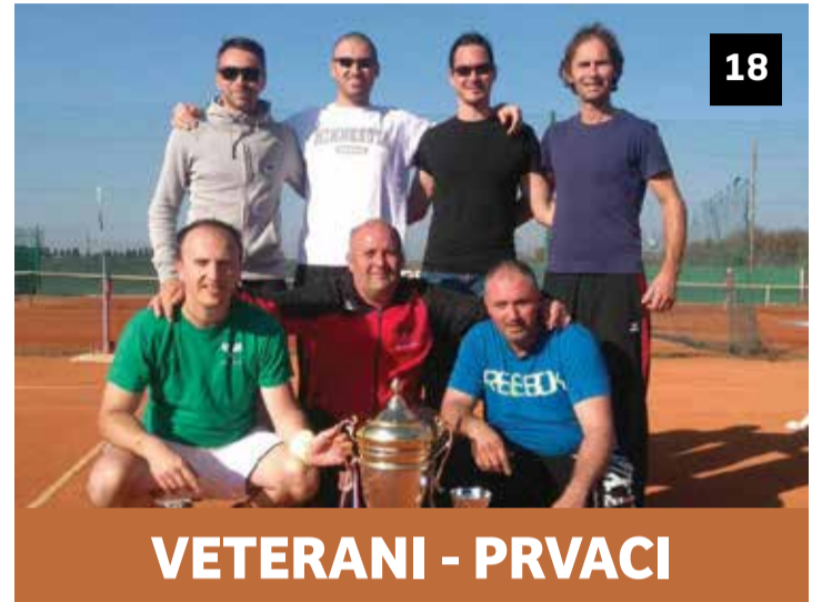
VETERANI - PRVACI