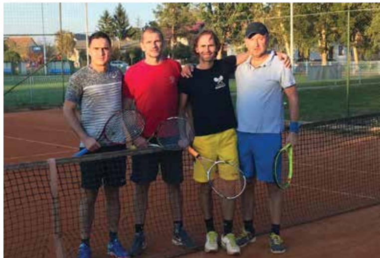
Finalisti turnira parova