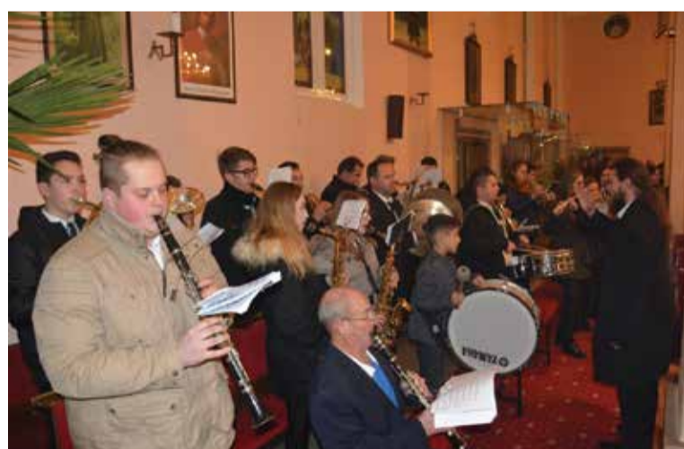
77. obljetnica posvećenja crkve