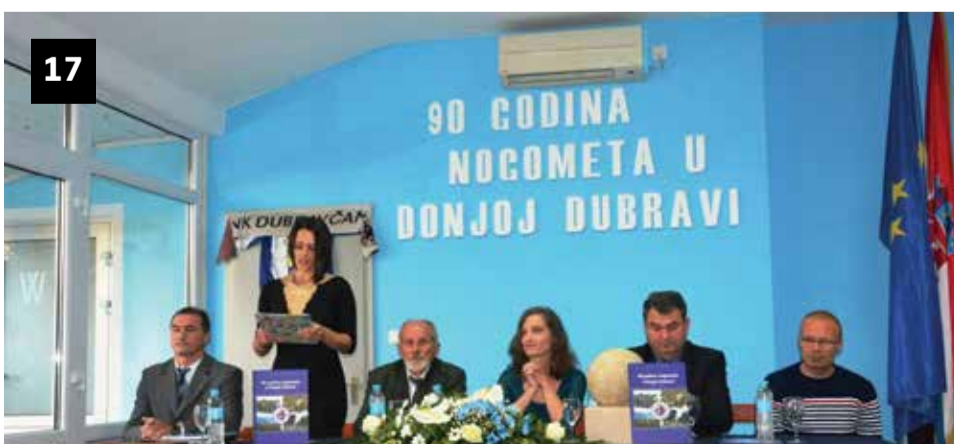
90 GODINA NOGOMETA U DONJOJ DUBRAVI