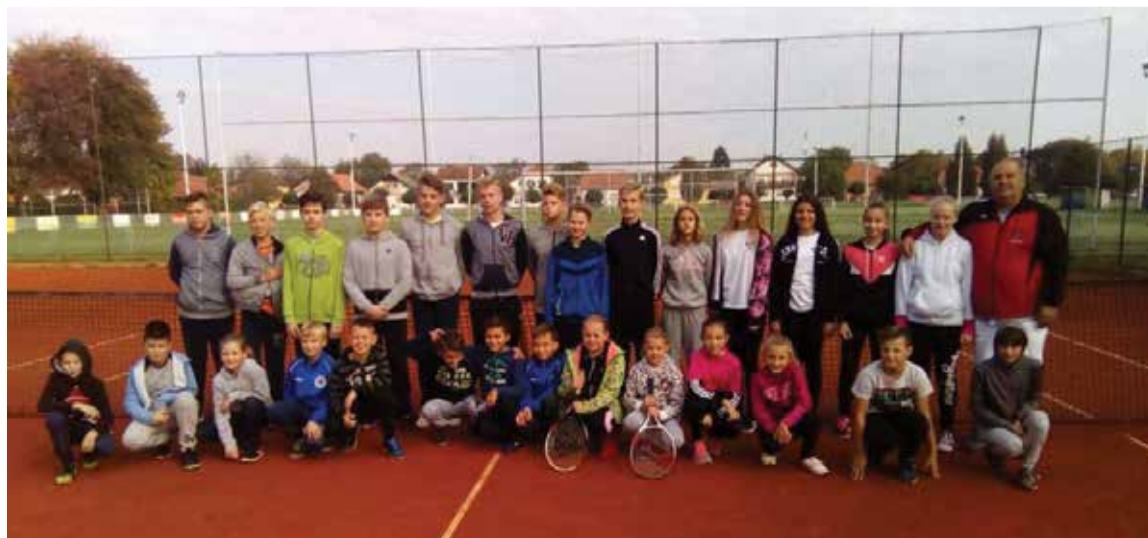
Škola tenisa 2017.

Među početnicima vodila se velika bitka za prvo mjesto jer je na kraju 7 vježbi rezultat bio izjednačen i pobjedniku smo dobili u razigravanju.