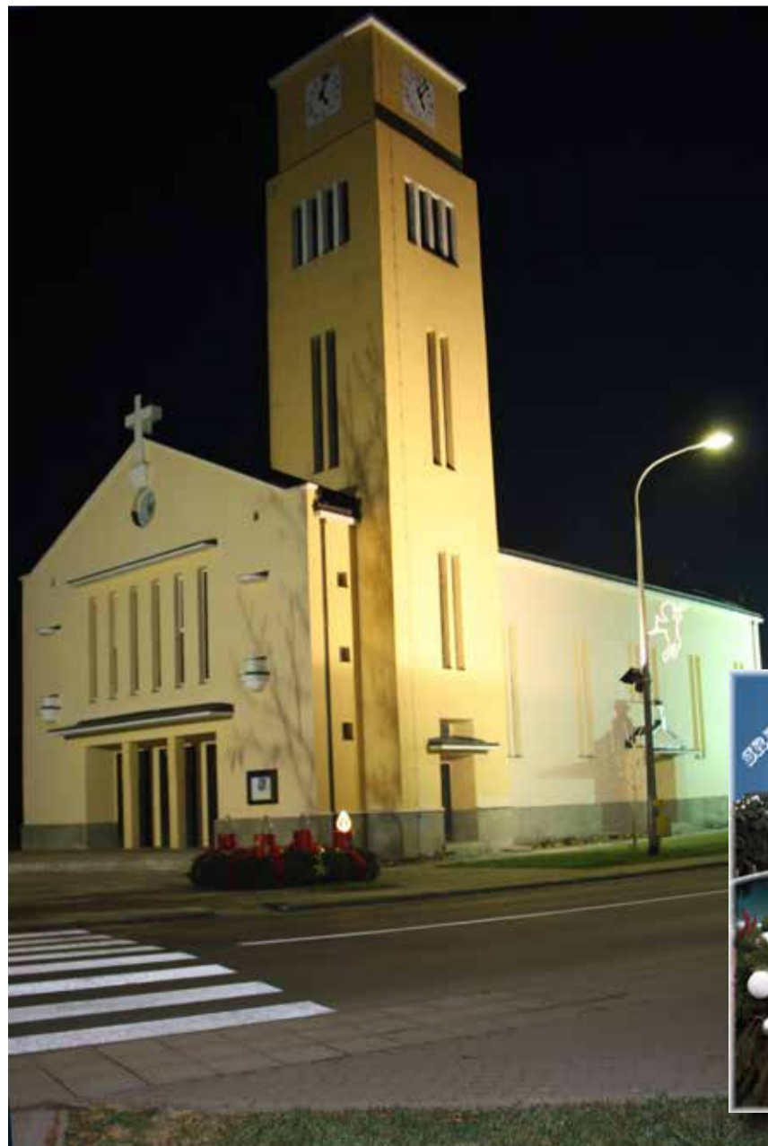
Autorica: Milica Janjatović

Svim čitateljima Dobravskih novina članovi Uredništva žele sretan Božić i Novu godinu!