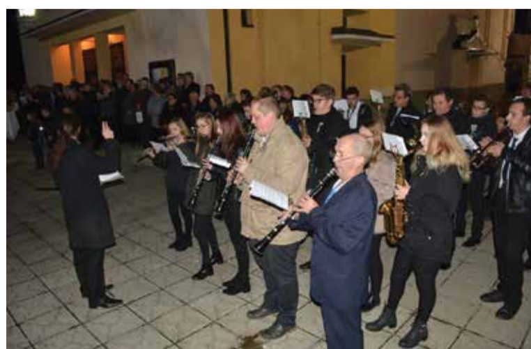
77. obljetnica posvećenja crkve

zainteresirane mladiće i djevojke da se jave prof. Antunu Horvatu ili predsjedniku Zoranu Horvatu i iskoriste priliku da nauče svirati neki puhački instrument i otkriju radost sviranja u orkestru.