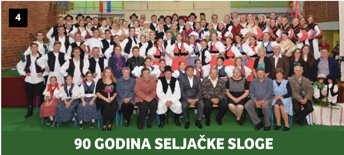
90 GODINA SELJAČKE SLOGE