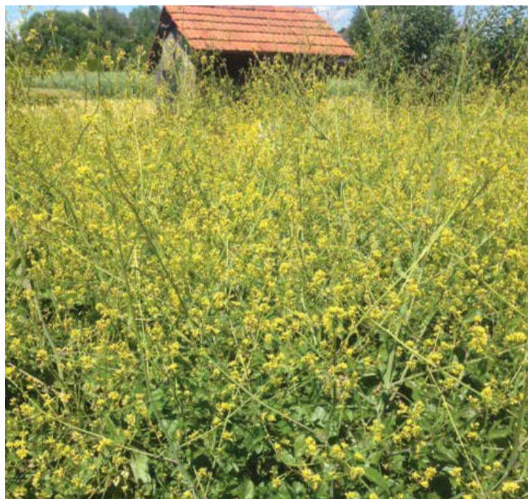
Muštarđa u cvatu, u pozadini pčelinjak