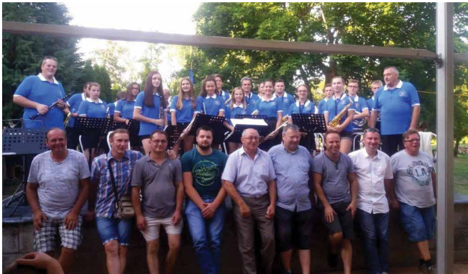
Nastup u Zalamerenyju