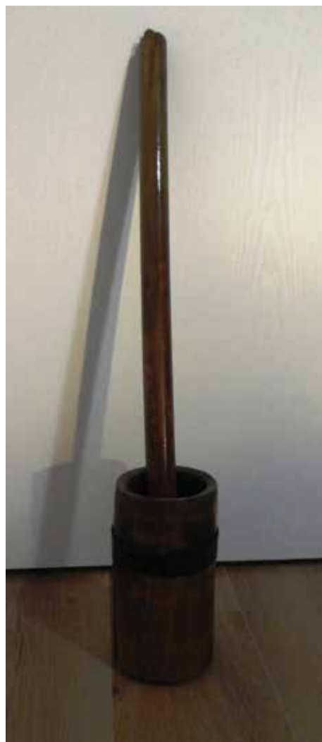
Mužar u kojem se tukla muštarđa

G: Jempot! Jempot na den. Unda je videti već treći den ako je gosto se nadeva. Već je videti zadnji den