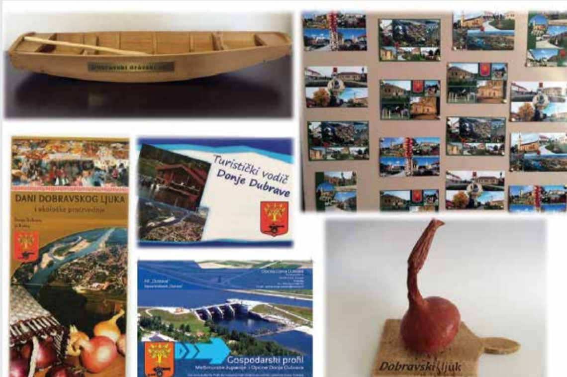
Dobravski suvenirni, razglednice i letci