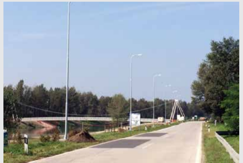
Javna rasvjeta na ulazu u Donju Dubravu

Značajan projekt je i izrada termofasade sa stručnim nadzorom na Domu