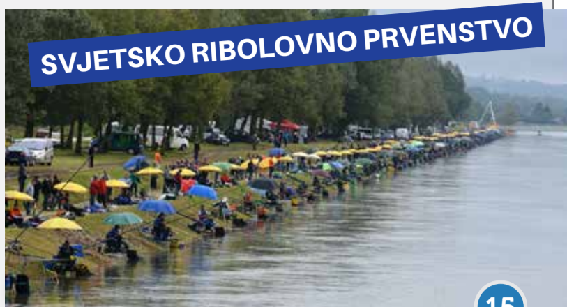
SVJETSKO RIBOLOVNO PRVENSTVO