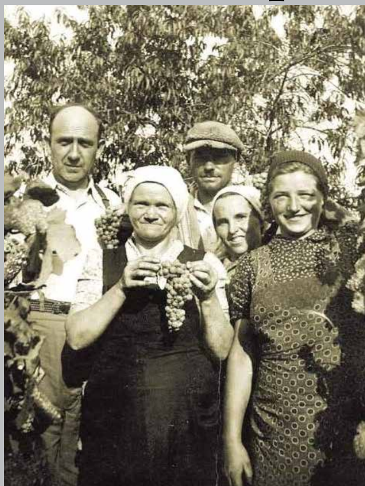
Berba grožđa v dobravskim goricama na Legradskoj gori 1939. godine