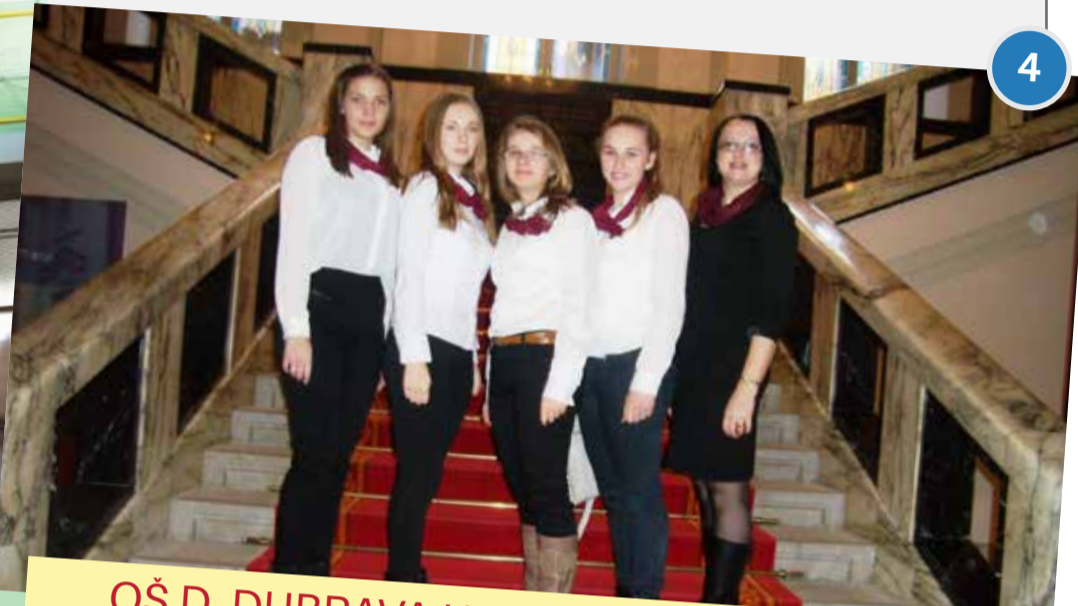
MALI FOLKLORAŠI NA DRŽAVNOJ SMOTRI