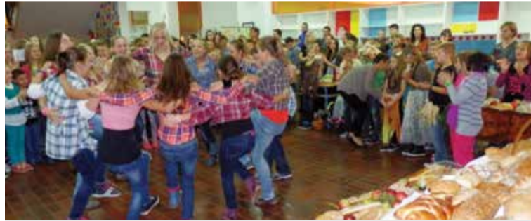
Nastup učenika iz Bizonje

jim vrtićem s dvojezičnom nastavom iz Bizonje u Mađarskoj te našom školom. U projekt su uključeni učenici, učitelji, roditelji i lokalna zajednica. Ovaj je susret sufinanciralo i Ministarstvo znanosti, obrazovanja i sporta. Dvadesetčetvero učenika stiglo je 9. listopada u pratnji triju učiteljica