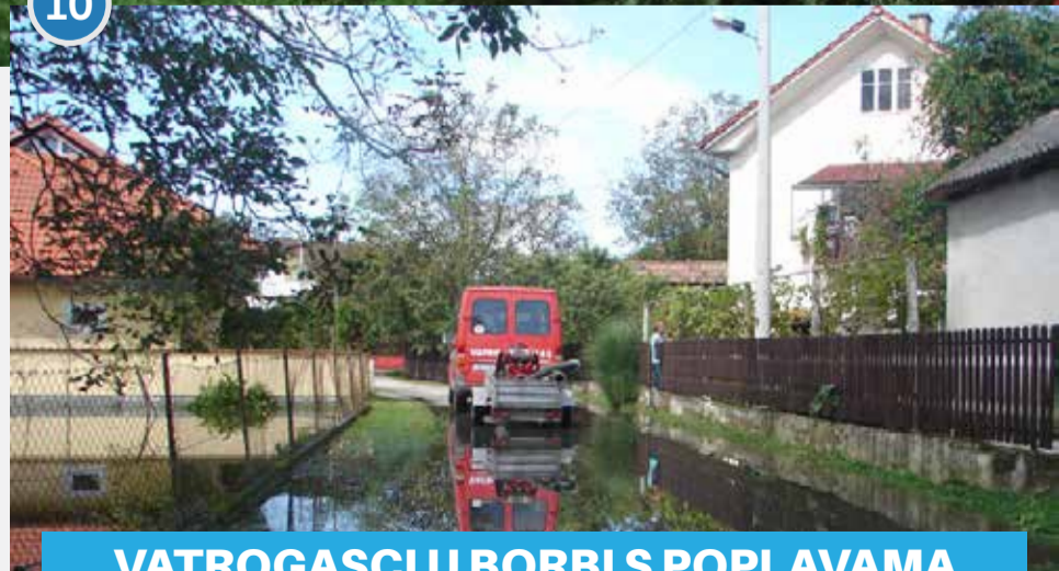
VATROGASCI U BORBI S POPLAVAMA