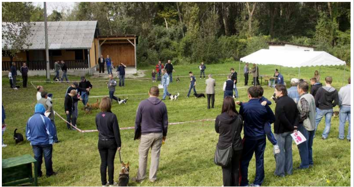
Izložba malog međimurskog psa