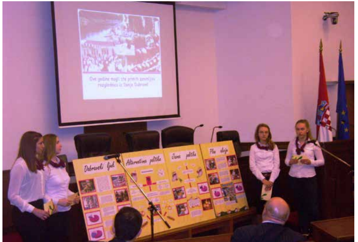
Izlaganje naših učenica o projektu „Dobravski ljuk“

Školska smo događanja, za prvo polugodište, zaočuzili obilježavanjem Dana sjećanja na žrtvu Vukovara. Učenici i učitelji OŠ Donja