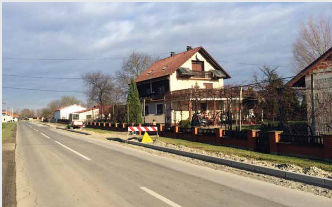
Radovi na pješačko-biciklističkoj stazi u ulici 3. travnja

jalom iznosila je 142.790,00 kn. Shvaćanja glede postavljanja te rasvjete su različita, no ja osobno i dalje smatram da se njome zaista još jedan dio našeg mjesta stavio u pravu funkciju korištenja i