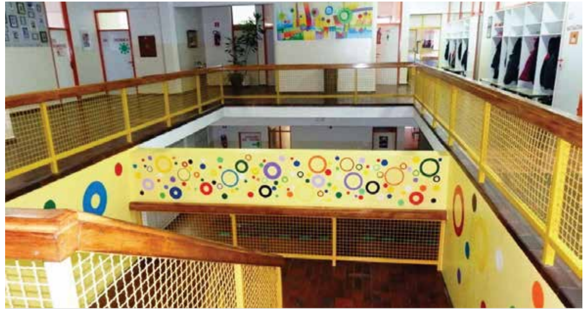
Osvježeni školski hodnici

i ravnateljice škole. Nakon kratke okrijepe i odmora održan je svečani dio su-