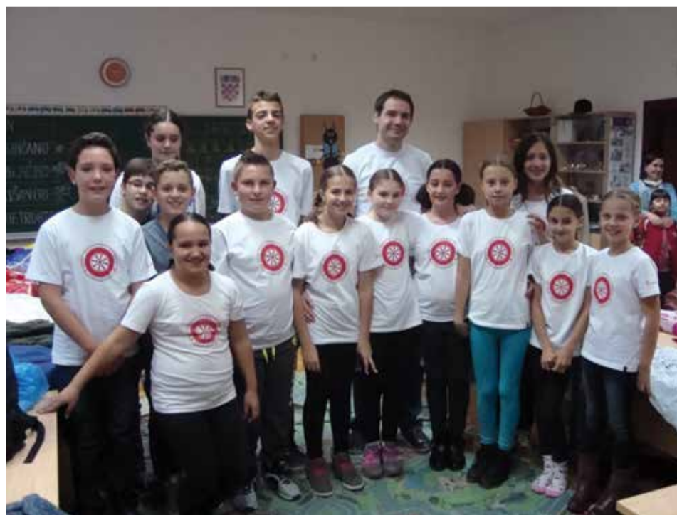
Slogaši u majicama