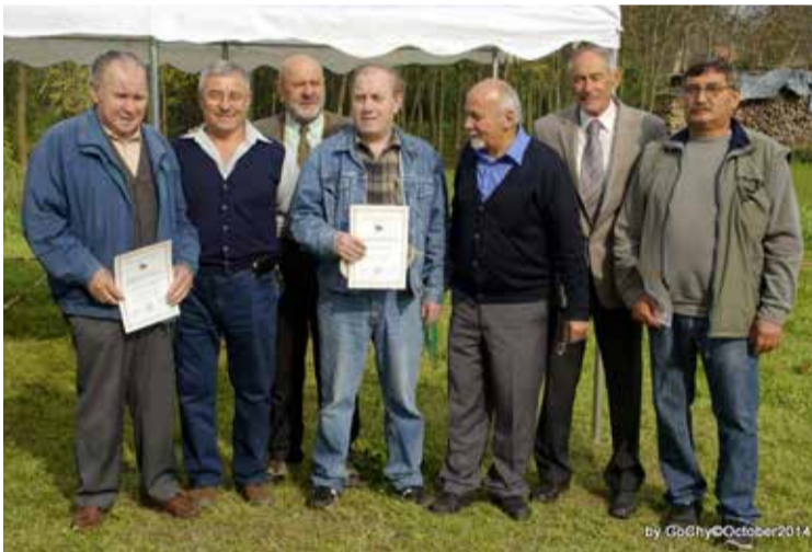
UDRUGA OBRTRNIKA I PODUZETNIKA DONJA DUBRAVA