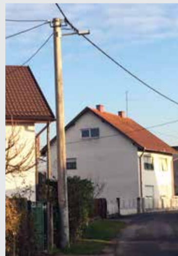
LED javna rasvjeta u ulici J. Slavenskog

Međimurska lastavica u vrijednosti od 83.174,36 kn. Projekt smo kandidirali na natječaj Ministarstva regionalnog razvoja i fondova EU te nam je odobreno 80 % sredstava, dok se Općina po ugovoru obavezala isplatiti izvođaču radova preostalih 20 % sredstava.