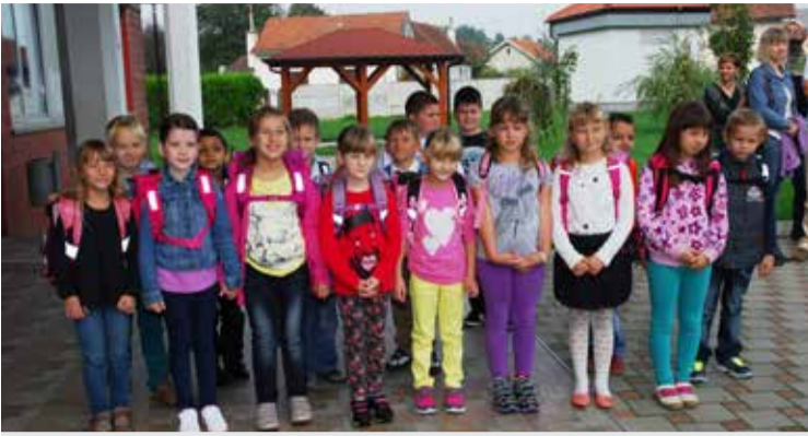
Uzbuđenje prvašića na prvi dan škole

DOBRAVSKE NOVINE • BROJ 43 • 25. 12. 2014. • www.donjadubrava.hr