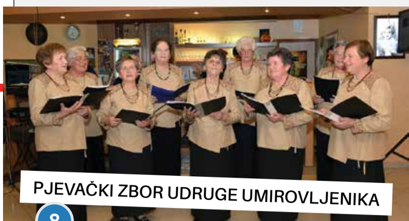
PJEVAČKI ZBOR UDRUGE UMIROVLJENIKA