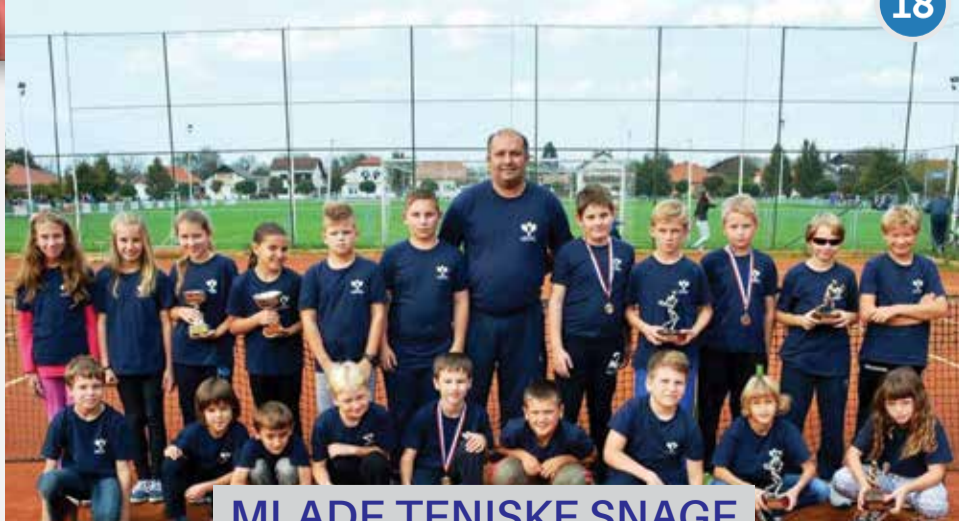
MLADE TENISKE SNAGE