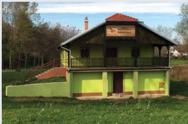
Nova fasada Doma „Medimurske lastavice“

energetsku učinkovitost osigurano je 40 % sredstava. Ostali dio od 60 % po sklopljenom ugovoru osigurala je Općina.