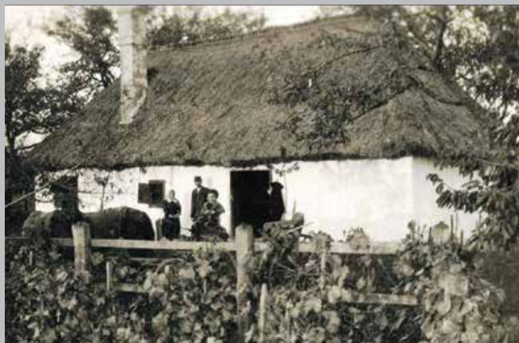
Štefićeva klijet na Legradskoj gori snimljena 1947. godine.

Godine 1948. došla je Rezolucija Informbiroa i prekid sa Staljinom. Granica prema Mađarskoj je zatvorena te je tuda povučena „željezna zavjesa“. Uz rigorozni nadzor dobravski dvovlasničari su mogli u svoje gorice još do jeseni 1949. godine. Tih se posjeta najviše sjećam. Pregledi na brodu na Muri bili su rigorozni i neugodni. Ma-