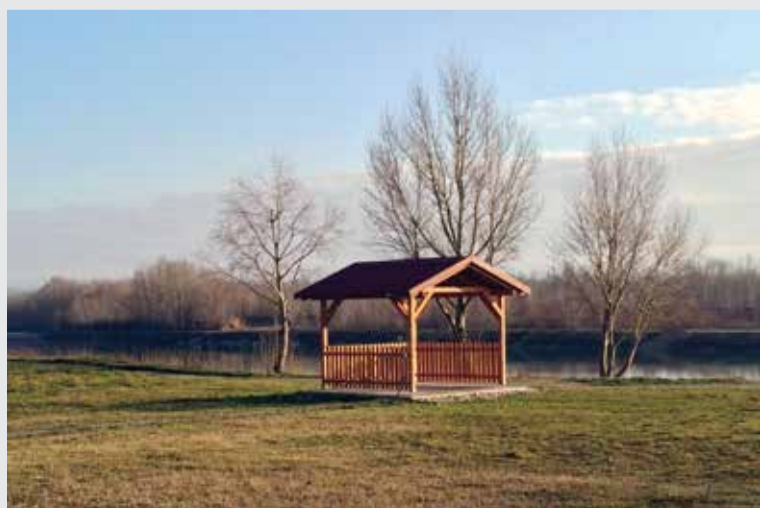
Drvena nadstrešnica uz Dravu

da novog prostornog plana Općine koji smo započeli prvenstveno zbog staavljanja u funkciju novih 10 hektara zemljišta za proširenje gospodarske zone, u kojoj bi se formirale nove čestice prema potrebama mogućih zainteresiranih investitora. Trenutačno Općina raspolaže samo s jednim slobodnim građevinskim zemljištem u gospodarskoj zoni „Sjeveroistok“ koje je spremno za prodaju.