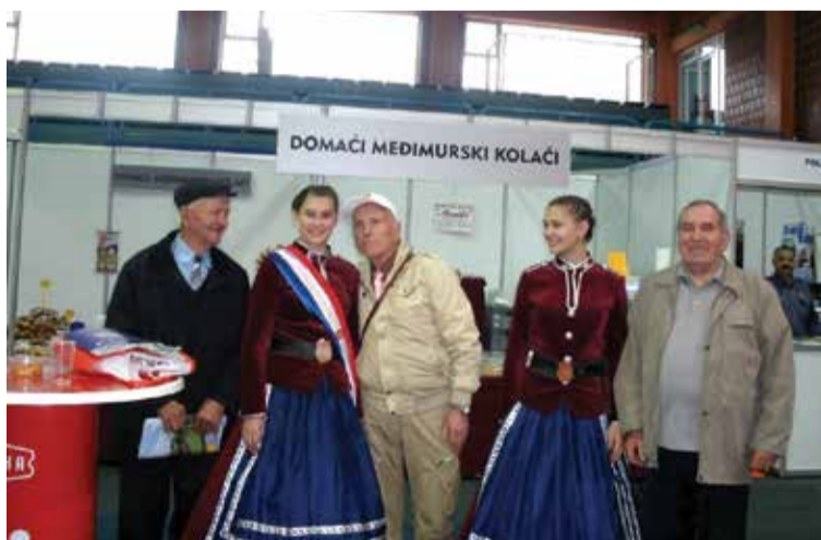
Naši dečki s najstražaricom Križevačke djevojačke straže

Posjet Sajmu održan je u nedjelju, 9. 11. 2014. godine. Bio je to 17. Obrtnički i gospodarski sajam. Na Sajmu se okupilo 255 izlagača, od čega 98 obrtnika, 106 tvrtki, 25 obiteljskih poljoprivrednih gospodarstava, 26