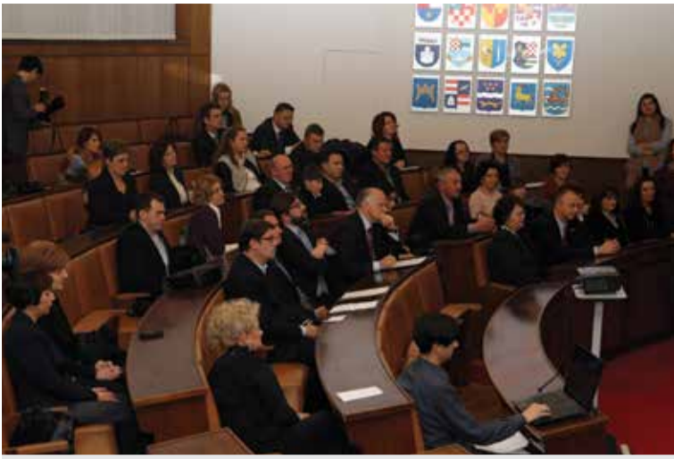
Zastupnici, načelnici i gradonačelnici na predstavljanju projekata u Hrvatskom saboru

ovom je natjecanju rezultirao izvanrednim 3. mjestom. Učenicke su prvi susret igrale protiv OŠ Šenkovec i izgubile 2:3 te su potom u borbi za 3. mjesto pobijedile I. OŠ Čakovec rezultatom 3:1. Svim učenicima čestitamo još jednom na borbenosti