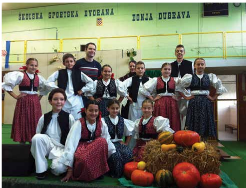
Pomladak "Seljačke sloge"