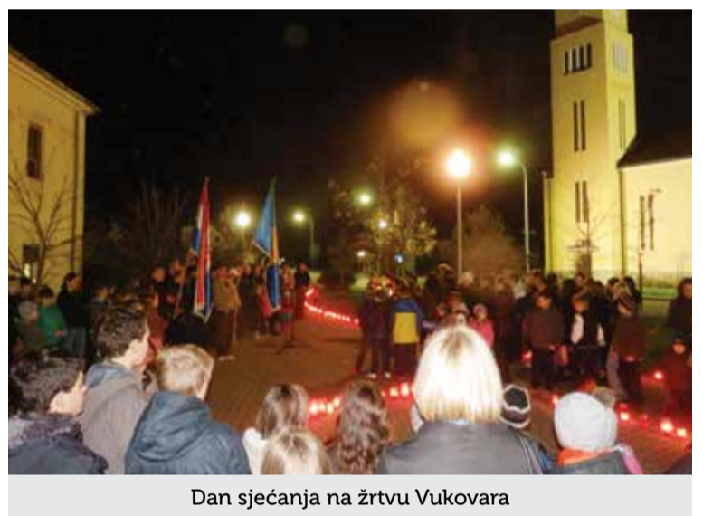
Dan sjećanja na žrtvu Vukovara