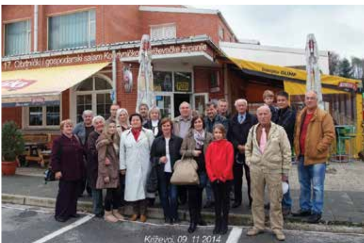
Posjet Obrtničkom i gospodarskom sajmu u Križevcima

Tijekom drugog polugodišta 2014. godine članovi Udruge obrtnika i poduzetnika organizirali su posjet poznatom Obrtničkom i gospodarskom sajmu Koprivničko-križevačke županije u Križevcima.