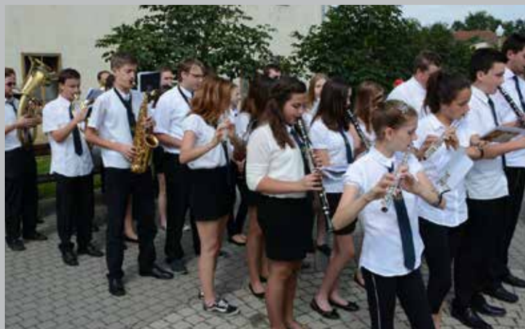
h. Ove ćemo godine na koncertu ugostiti Puhački orkestar Dobrovoljnog vatrogasnog društva Đurđevac.

Ujedno vas sve lijepo pozivamo na naš Božićni koncert koji će se tradicionalno održati 26. prosinca, u petak, na Štefanje u 16:00