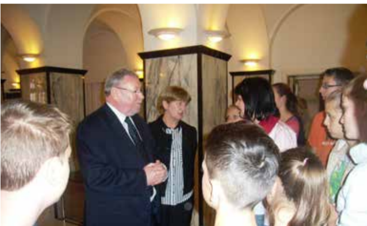
Gosti iz Bizonje posjetili Hrvatski sabor

(19 godina!) koja se realizira uzajamnim susretima s Osnovnom školom i dječ-